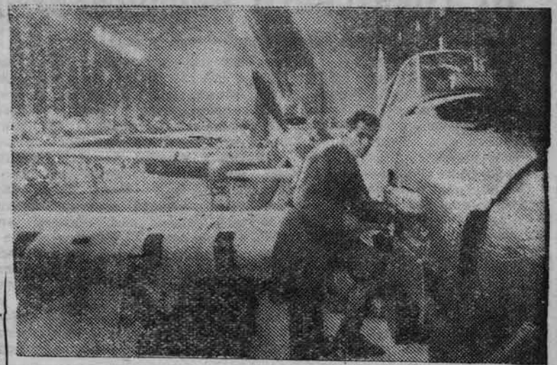
Н-ский орденоносный авиастроительный завод НА ОНИМЖЕ: в сборочном цехе. Монтаж боевых машин.