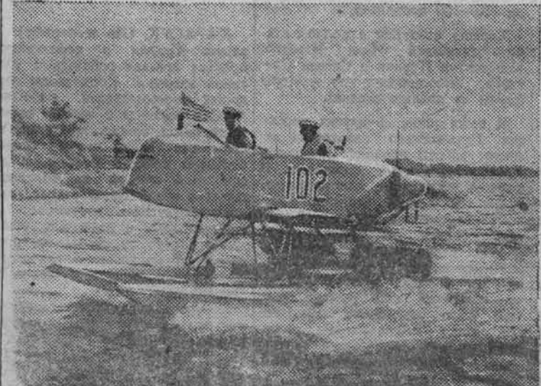
Борьба с вражескими подводными лодками. НА СНИМКЕ: глиссер, построенный в США для борьбы с подводными лодками. Оборудованный мотором с воздушным винтом, глиссер развивает скорость до 80 км в час. На его вооружении — 4 глубинные бомбы, малокалиберная пушка и пулемёт. В случае надобности он может быть принят на борт крупного корабля, а затем снова спущен на воду.