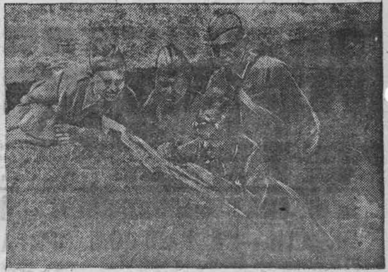
Большевицкая печать на фронте. НА СНИМКЕ: выпуск боевого листка на передовой линии.

Н-ская гвардейская часть живет полнокровной боевой жизнью. Она уничтожает врага, учится воевать по суворовски с малой кровью и большими победами. «Красноармейская правда» последовательно и умело прививает любовь гвардейцам к великому русскому полководцу. При этом делается это увлекательно и по-армейски эдорово. «Если мне сказано идти вперед, — я не знаю, что такое усталость», — так говорил Суворов. Под таким эпитаграмм газету помещает своеобразную боевую консультацию «Запомни, воин!» «Ничего не щадить, не взирая на трудности, преследовать неприятеля днём и ночью, пока истреблен не будет...» Эти суворовские слова также послужили темой для острой, увлекательной газетной подборки. В одном из номеров целая страница посвящена суворовской науке побеждать. «Бить немцев по-суворовски» называется эта страница. В ней бойцы-гвардейцы рассказывают, как они претворяют в жизнь суворовские принципы ведения войны. «Где тревога — туда