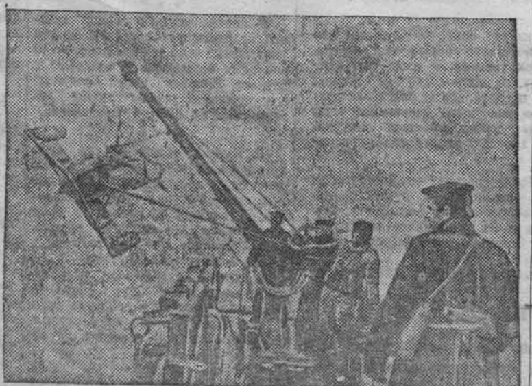
Черноморский флот. НА СНИМКЕ: группа минёров Н-ского тральщика ставит параван для подсекания вражеских мин.

Тов. М. И. Калинин сердечно поздравил полковника Л. И. Свобода с получением награды и пожелал дальнейших боевых успехов ему лично. (ТАСС).