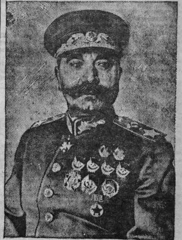
Маршал Советского Союза Семён Михайлович Будённый. К шестидесятилетию со дня рождения.