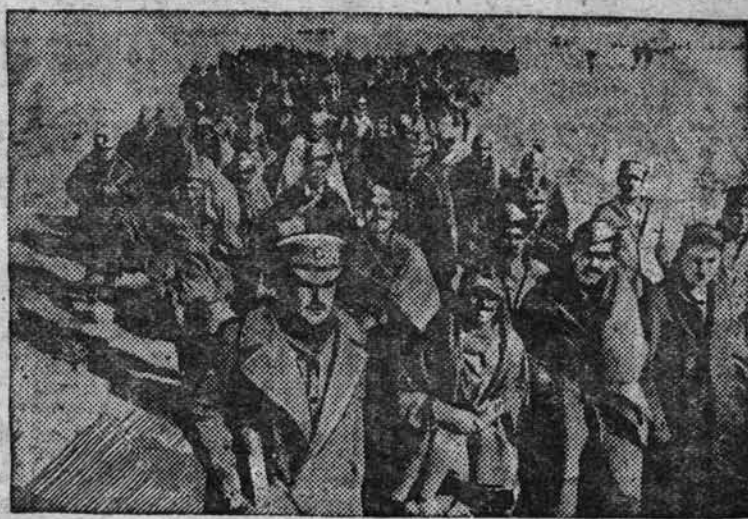
Захваченные союзными войсками пленные немецкие и итальянские солдаты из армии Роммеля.

Большое соединение «Летающих крепостей» подвергло интенсивной бомбардировке железнодорожные объекты и аэродромы в Палермо. Отмечены многочисленные взрывы бомб в районе цели.