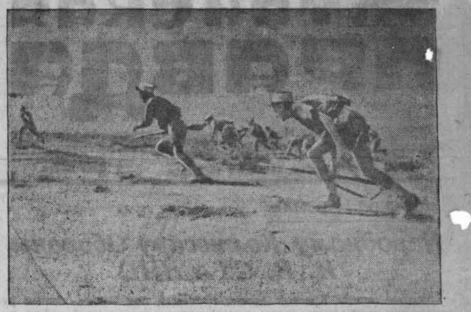
Война в Африке. НА СНИМКЕ: французские солдаты, сражающиеся на стороне союзников, идут в бой.

В заводском районе Сталинграда наши штурмовые отряды выжили немцев еще на нескольких улицах и зданиях.