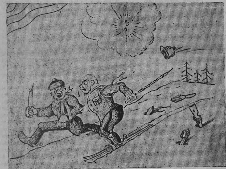
— Вы слышали новость? Французские газеты уверяют, что мой взвод и ваша рота захватили Амурскую железную дорогу... Рис. М. Отарова. (Фото-клише ТАСС).

НЬЮ-ЙОРК, 6 февраля. (ТАСС). Выходящая в Гаване (Куба) газета «Нотисас де Ой» сообщает об окончании забастовки рабочих 20 сахарных заводов, расположенных в различных частях Кубы. Рабочие добились увеличения заработной платы и удовлетворения ряда других своих требований.