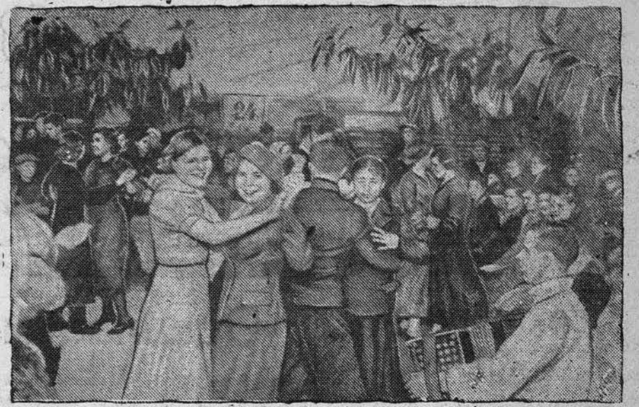
На 10 избирательном участке (содгородок меланжевого комбината). Культурно и весело провели избиратели день выборов — 24 декабря 1939 года.

Новое почтовое отделение открывает Барнаульская контора связи при кирпичном заводе промартеля «Сила».