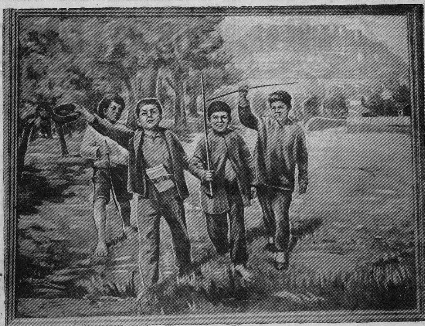
С Тифлисской выставки живописи, скульптуры и графики на тему: «К истории большевистских организаций Грузии, Закавказья» Г. А. НИМКЕ: картина художника Д. Волгина «Сталин в детстве». Т. Тифлис, 1936 г.