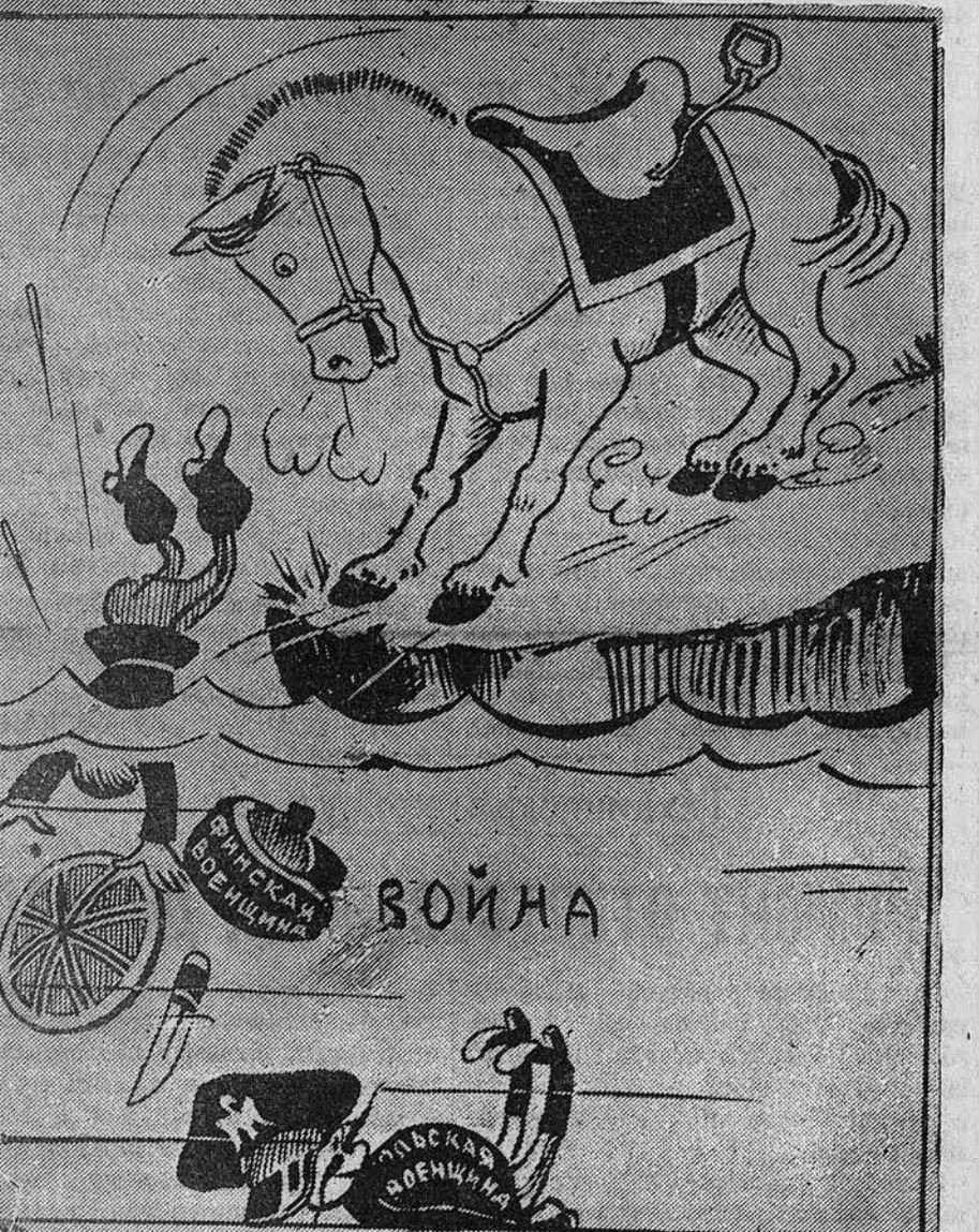
Вот Фома идет на дно, а Брема там давно... Рязунок В. Персон. (Фото-клише ТАСС).

1-й КИНО-ТЕАТР — Сегодня новый звуковой художественный фильм УЧИТЕЛЬ. Сеансы: 5, 6-45, 8-30, 10-15. Касса с 3-х часов дня.