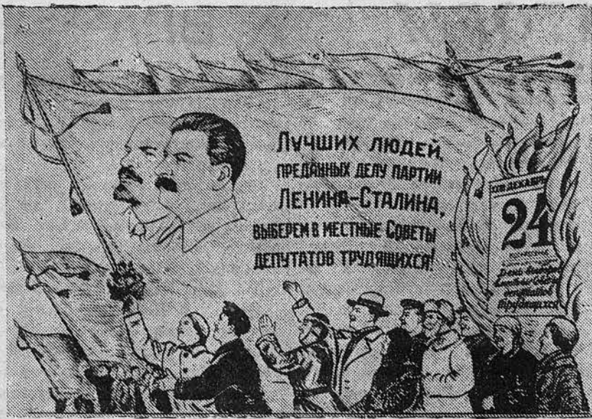
Рис. В. Баркова и В. Лисевича.

Чего стоят решения Лиги наций, принятые в подобной атмосфере, — не трудно понять.