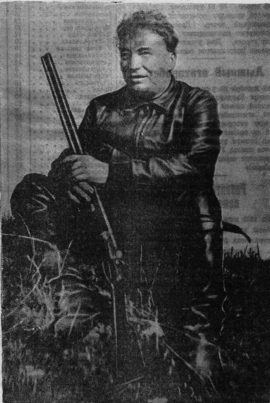
Товарищ В. П. Чкалов на охоте (Горьковская область).

Комбриг И. СПИРИН, Герой Советского Союза.