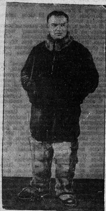
Герой Советского Союза товарищ В. П. Чкалов. (Снято в Париже, в ноябре 1936 года).