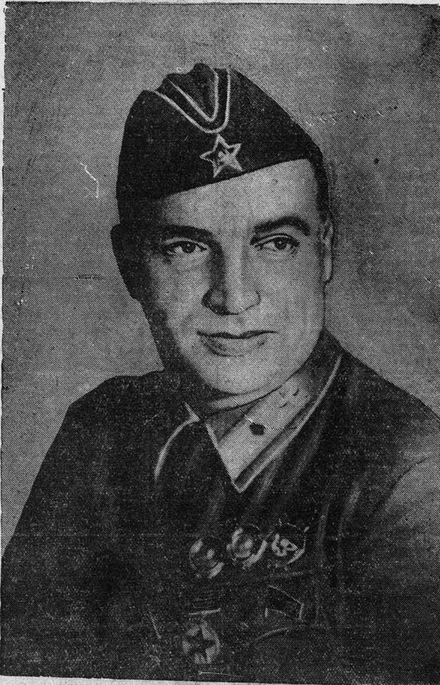
Герой Советского Союза, депутат Верховного Совета СССР, комбриг В. П. Чкалов.

Чкалов! Это имя будет вечно жить в сердцах миллионов, олицетворяя мужество и героизм пламенного советского патриота, бесприменно преданного своей родине и любимому товарищу Сталину. Образ великого летчика нашей эпохи всегда будет служить ярким примером того, каким должен быть советский гражданин, будет служить нам примером того, как надо жить и творить во славу своего социалистического отечества.