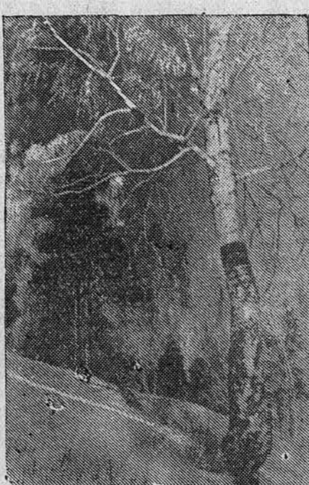
Вблизи города Барнаула.

На днях Барнаульская база КОГИЗа получила 9.000 экземпляров цветной экономической карты Алтайского края. Карта пользуется у покупателей большим спросом.