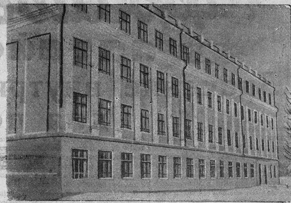
Новое здание средней школы № 7 гор. Барнаула на 1500 мест.

На озере Зеркальском, Шипуновского района, рыболовецкая артель «Красные Зеркальцы» за 19 и 20 ноября добыла 35 центнеров рыбы, артель «Обской рыба», Павловского района, за последние дни выловила 60 центнеров. Развернулась также путина в Калманском и Топчихинском районах. Отстающим районом, несмотря на все условия для успешного лова, является Славгородский.