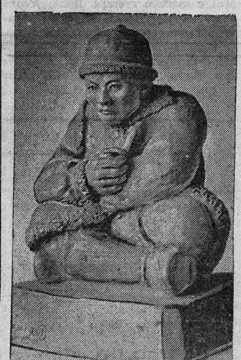
Скульптура Ойрот*, хранящаяся в педагогическом училище в гор. Ойрот-Туре Ойротской автономной области.

На состоявшихся в Воронеже всесоюзных соревнованиях по борьбе центрального общества «Пишневик» преподаватель физкультуры Барнаульского сельскохозяйственного техникума тов. Лобастов занял 3-е классное место.