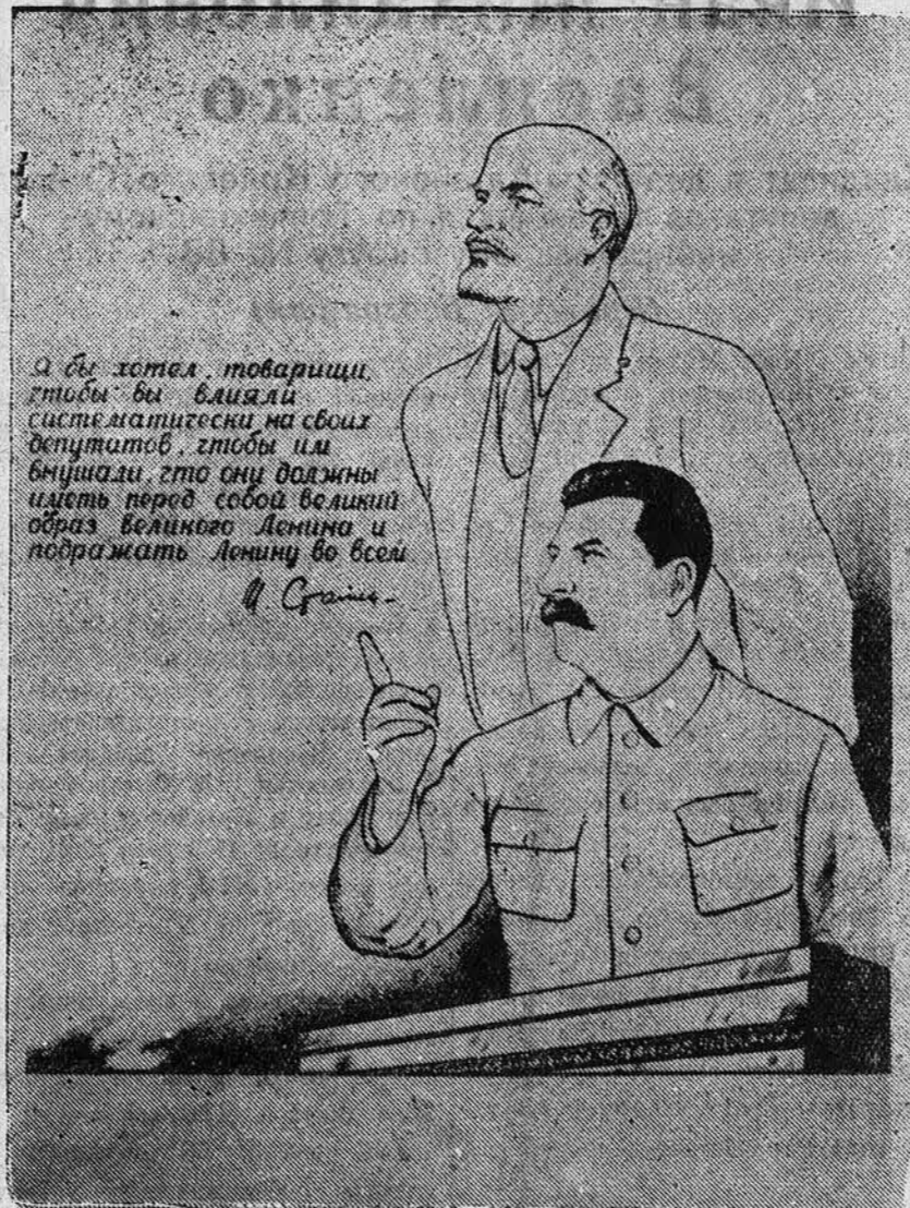
Рис. Г. Бедарева и Г. Вальк.