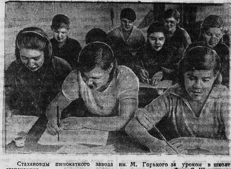
Стахановцы пимокатного завода им. М. Горького за уроком в школе стахановцев.

завод, птицекомбинат, два маслозавода, хлебокомбинат и другие. Создан целый ряд новых отраслей промышленности по линии промкооперации. Сейчас промышленность Барнаула представлена 60 предприятиями и 21 промышленной артелью. В них занято до 25 тысяч рабочих и служащих. На одном только меланжевом комбинате занято более 10 тысяч человек. Колоссален рост выпускаемой продукции. В 1927 году валовая продукция промышленности Барнаула составляла 13 миллионов 746 тысяч рублей, на конец первой пятилетки — 46 миллионов 894 тысячи рублей, а к концу второй пятилетки валовая продукция уже выросла в 189 миллионов 351 тысячу рублей. За годы социалистического строительства в городе выросли десятки новых, красивых и благоустроенных жилых зданий и магазинов. Несколько больших зданий построено в центре города по Ленинскому проспекту. Закачивается строительство и отделка жилого дома Крайсполкома. В третьей сталинской пятилетке в Барнауле, ставшем центром Алтайского края, развернулось большое строительство. Рядом с меланжевым комбинатом воздвигается новый, крупнейший в Сибири плательно-беловой комбинат. Он будет ежегодно выпускать 39 миллионов 447 тысяч метров ткани. Вместе с ним вырастет много крупных жилых домов и других культурных строений. Применение стахановских скоростных методов строительства, при все возрастающем оснащении строительной техники, еще более быстрыми темпами двинет вперед рост Барнаула. В. НЕГОДЕВ.