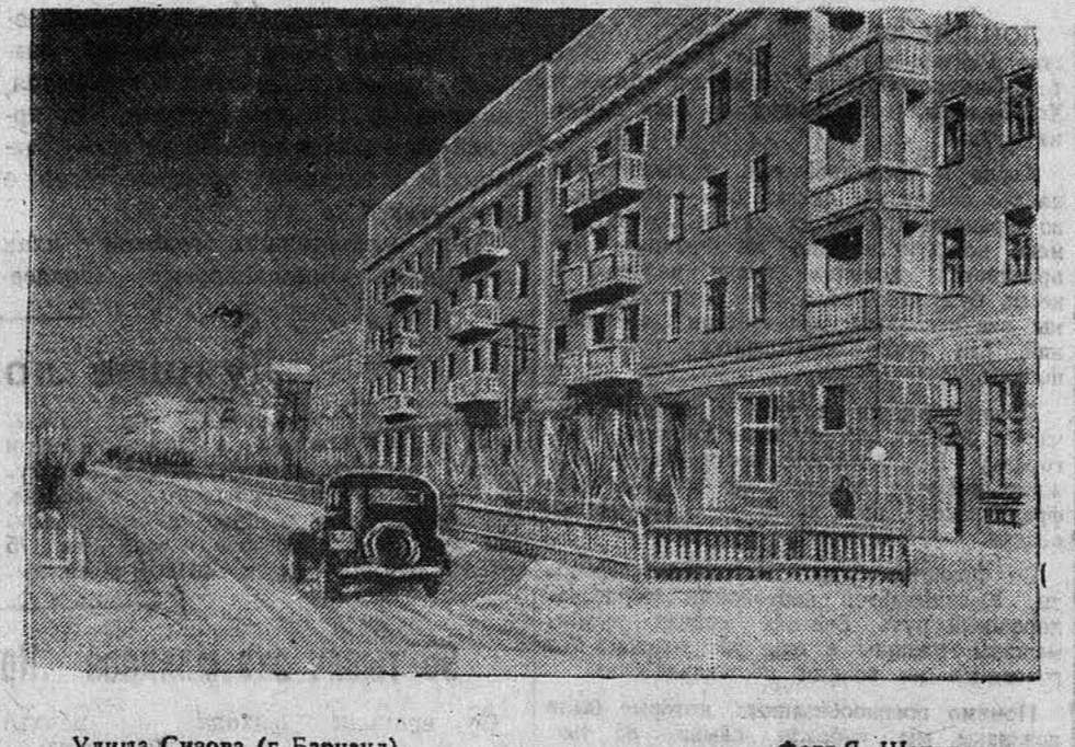
Улица, Сизова (г. Барнаул).

В 1747 году по указу императрицы Елизаветы Петровны завод был передан в ведение «кабинета ее величества». В распоряжение учрежденной императорским указом «канцелярии Колывано-Воскресенского горного начальства» перешли не только рудники, но и приписанные к ним крестьяне. Под управлением канцелярии в 1760 году находилось свыше 17 тысяч крепостных душ; к 1770 году число их возросло до 40 тысяч.