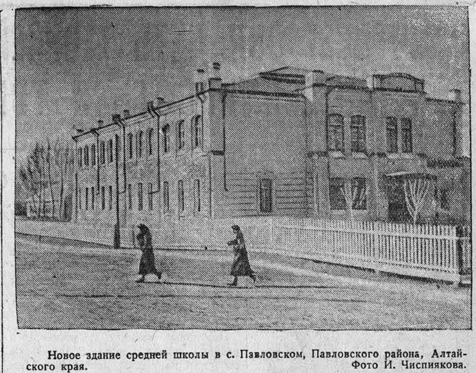
Новое здание средней школы в с. Павловском, Павловского района, Алтайского края.

не нескольких недель помещала статьи, подстрекавшие против Гитлера. Большая часть английских газет помещала на своих страницах снимки американского журнала „Кен“. На одном снимке изображен Гитлер, на котором направлен револьвер. На втором снимке Гитлер изображен на смертном одре. 4. Французское радио вечером 9 ноября передавало выступление одного француза, который, говоря о мюнхенском покушении, заявил: „Говорят, что бомба в Мюнхене взорвалась на 20 минут позднее. Это неверно. Она взорвалась на 7 лет позднее, так как еще в 1933 году Гитлер должен был умереть.“ 5. Агентство Рейтер сообщило: „Первая бомба, направленная против германской диктатуры, взорвалась сейчас в Мюнхене, многие другие еще последуют.“