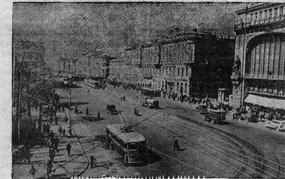
По городам Советского Союза. НА СНИМКЕ: проспект 25-го Октября (Ленинград).

ЧУНЦИН , 14 октября. (ТАСС). Сегодня 3 группы китайских самолетов бомбардировали японский аэродром и военные склады в Ханью. Уничтожено много японских самолетов, не успевших подняться. На военных складах возник пожар, продолжавшийся 3 часа. Навстречу китайским самолетам вылетели 20 японских истребителей. В воздушном бою, происшедшем над Ичаном, сбиты 3 японских истребителя.