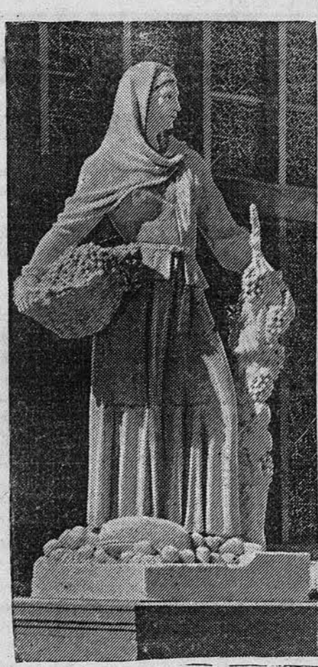
Скульптура, установленная у павильона Азербайджанской ССР, на Всесоюзной сельскохозяйственной выставке в Москве.

Наркомат промышленности стройматериалов ассигновал 1 миллион рублей на расширение и строительство новых кирпичных заводов в нашем крае в предстоящем году. 500 тыс. рублей из этих средств отпускается на расширение и механизацию кирпичных заводов № 1—2 в Ойрот-Тура. Здесь будет построена мощная гофманская печь, значительно расширена сушильная площадь. Производственная мощность завода увеличится с 3 до 5 миллионов штук кирпича в год. На остальные деньги намечается построение шести новых кирпичных заводов в районах Кулундинской степи.