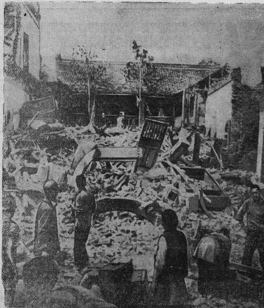
Японская авиация продолжает свои бомбардировки на мирные города Китая...