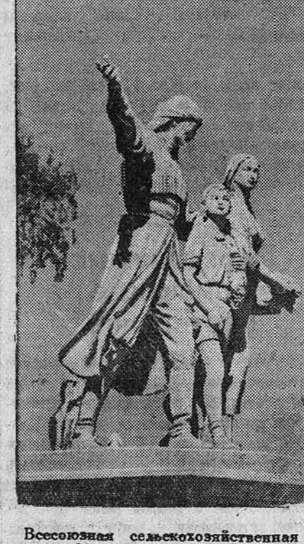
Бессовхозная сельскохозяйственная выставка в Москве. НА СНИМКЕ: скульптурная группа, установленная у павильона Грузинской ССР.

Продаются в неограниченном количестве сеновые бочки из-под живицы.