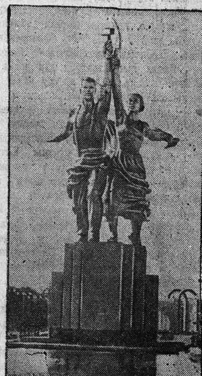
Всесоюзная сельскохозяйственная выставка в Москве. НА СНИМКЕ: скульптурная группа В. Музиной «Рабочий и колхозница», установленная перед входом на выставку.