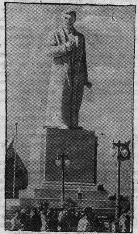
Всесоюзная сельскохозяйственная выставка в Москве. НА СНИМКЕ: памятник И. В. Сталина, установленный перед павильоном «Механизация».

ФЕРГАНА, 16 августа. (ТАСС). На строительстве большого Ферганского канала работает свыше 156 тысяч человек. С начала строительства вынито 8 миллионов 767 тысяч 517 кубометров земли — 54,2 процента плана.