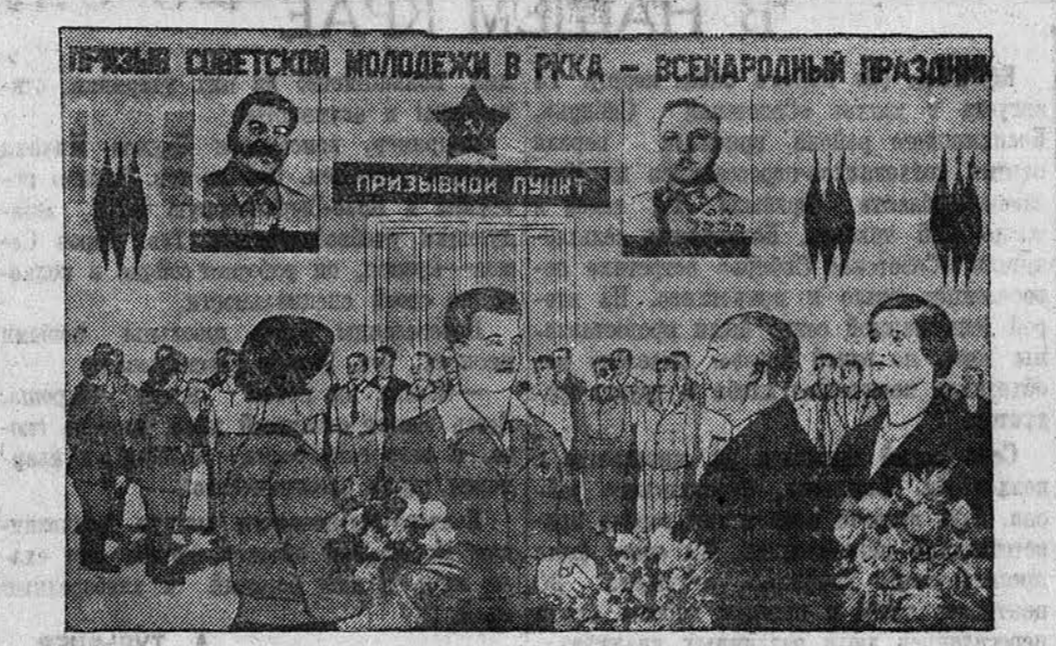
Плакат, посвященный предстоящему призыву в Красную Армию и Военно-Морской флот (работы художника С. Подобедова, выпуск Воензавода Наркомата Оборон СССР).