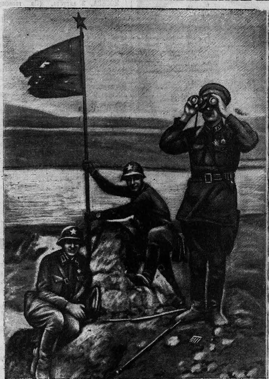
Командиры дальневосточники устанавливают на высоте Заозерной красный флаг, пробитый пулями и осколками гранат.

В Эмзеногорском районе на 5 августа были охвачены подпиской меньше 2 процентов колхозников и 25 процентов рабочих и служащих. Не лучше обстоит дело и в Залесовском районе, где охват займом колхозников не превышает одного процента. Слабо развивается работа по размещению займа в Алтайском, Благовещенском, Быстро-Истовском, Егорьевском, Краштинском и Ельцовском районах.