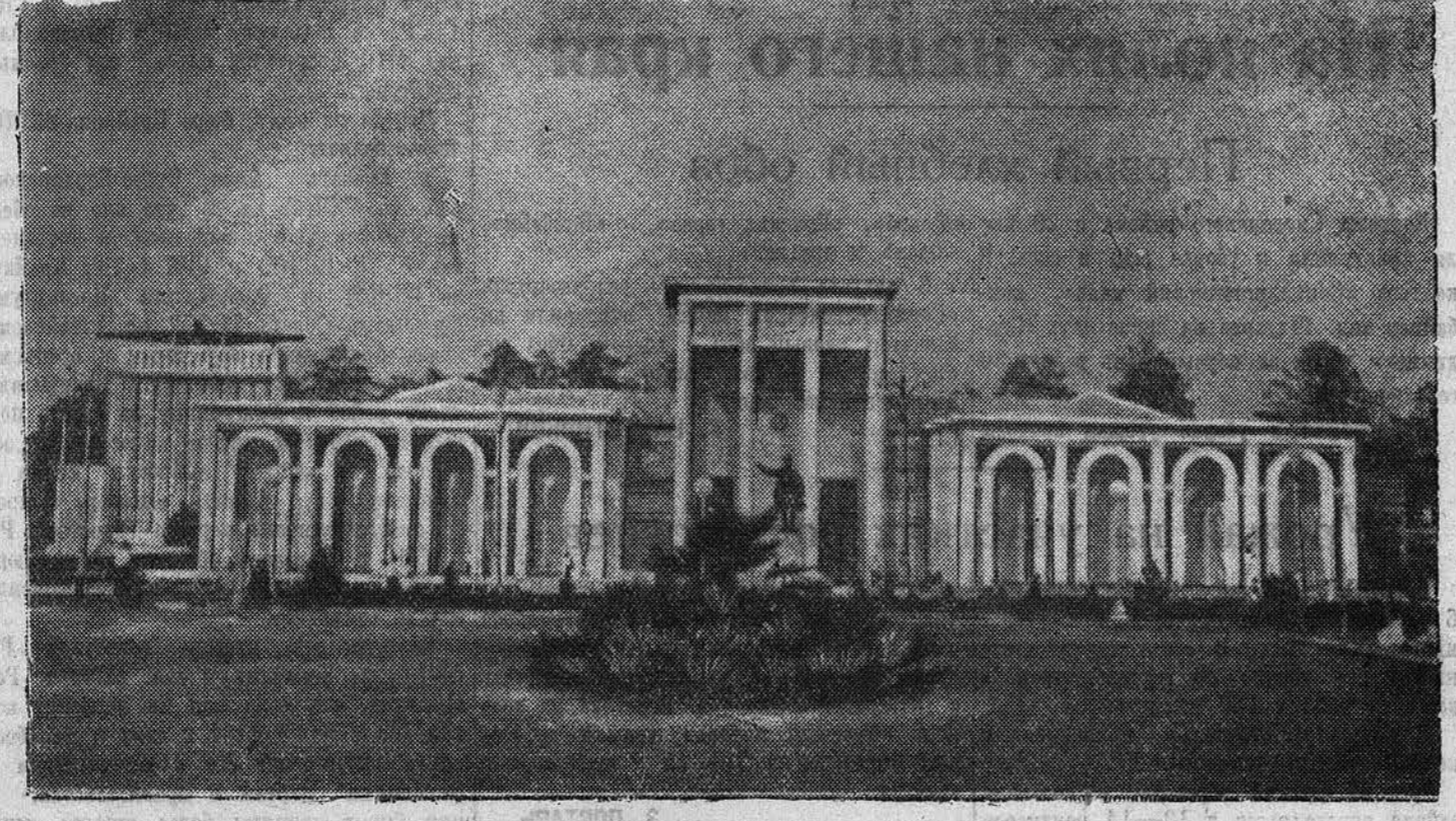
К открытию Всесоюзной сельскохозяйственной выставки в Москве. НА СНИМКЕ: павильон Ленинграда и Северо-Востока.