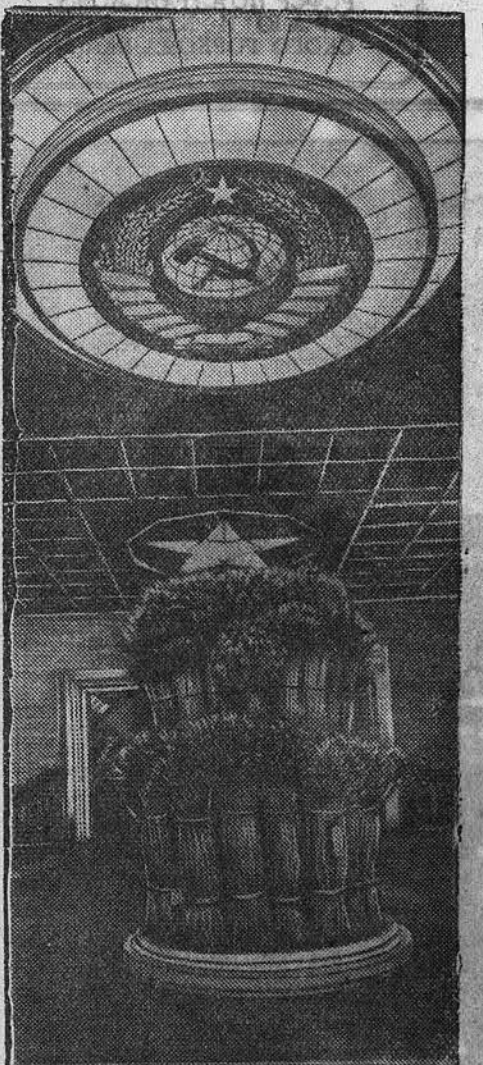
На Всесоюзной сельскохозяйственной выставке. НА СНИМКЕ: уголок главного зала павильона «Зерно».