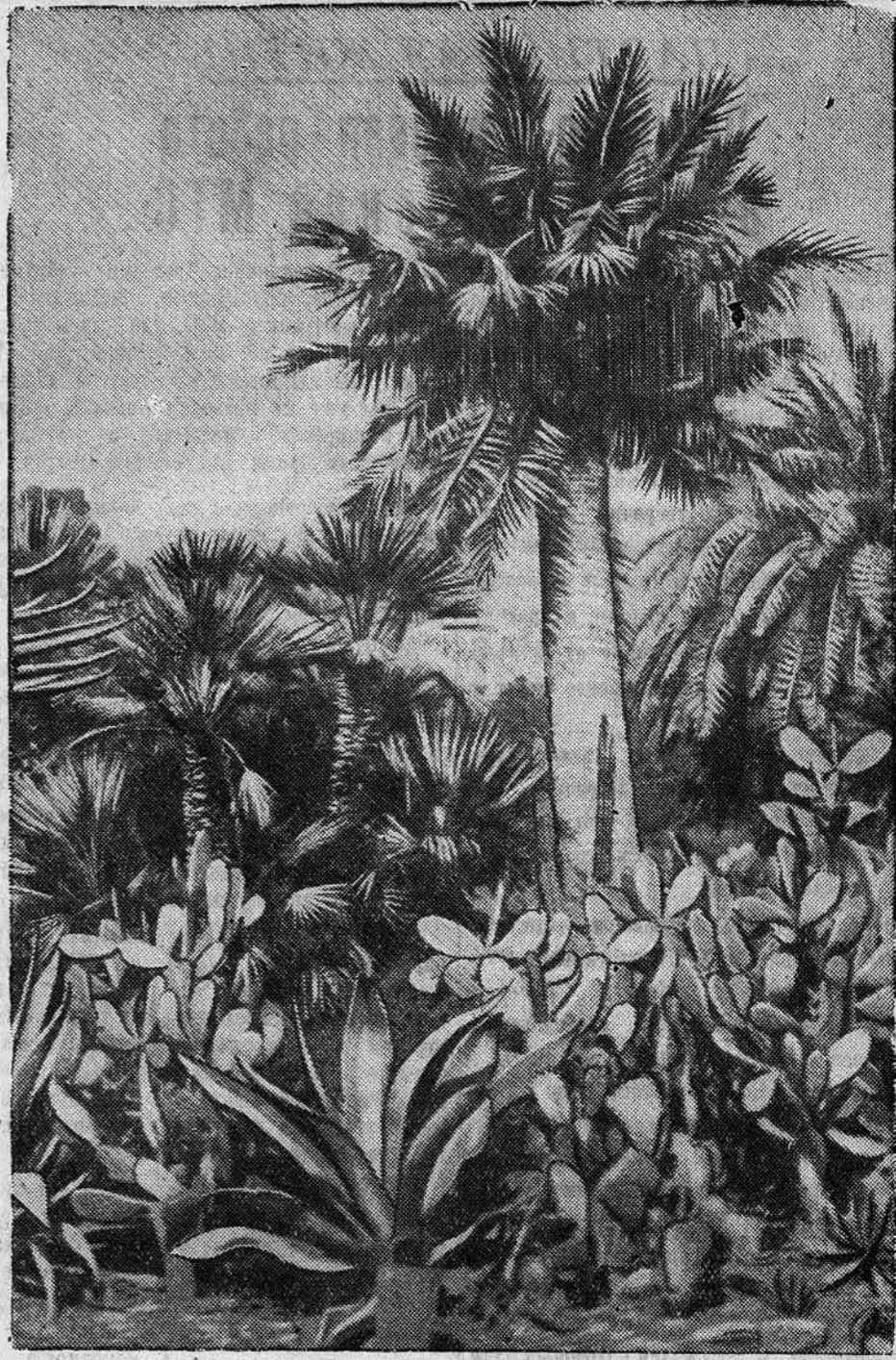
„Мексиканская горка“—уголок сада филиала Научно-исследовательского института чайных и субтропических культур (г. Сухуми, Абхазская АССР).

Квартиры и комнаты. Обращаться: Короленко, 105, ком. 12, и-во «Алтайская правда».