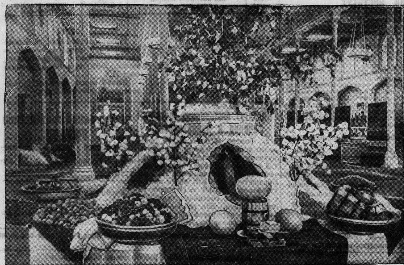
НА СНИМКЕ: экспонаты габардана Туркменской ССР.