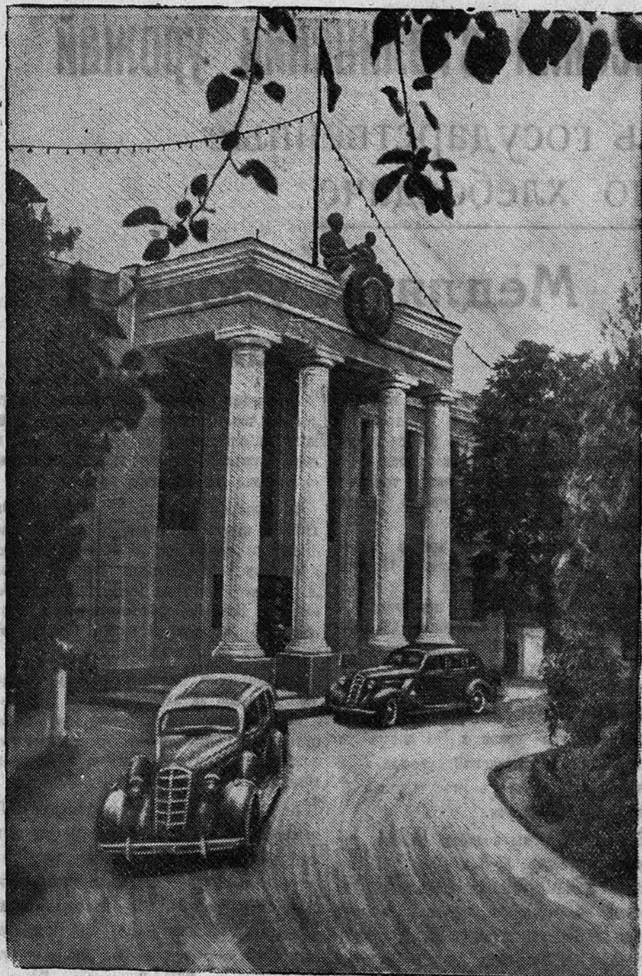
Здание Верховного Совета Туркменской ССР в Ашхабаде.