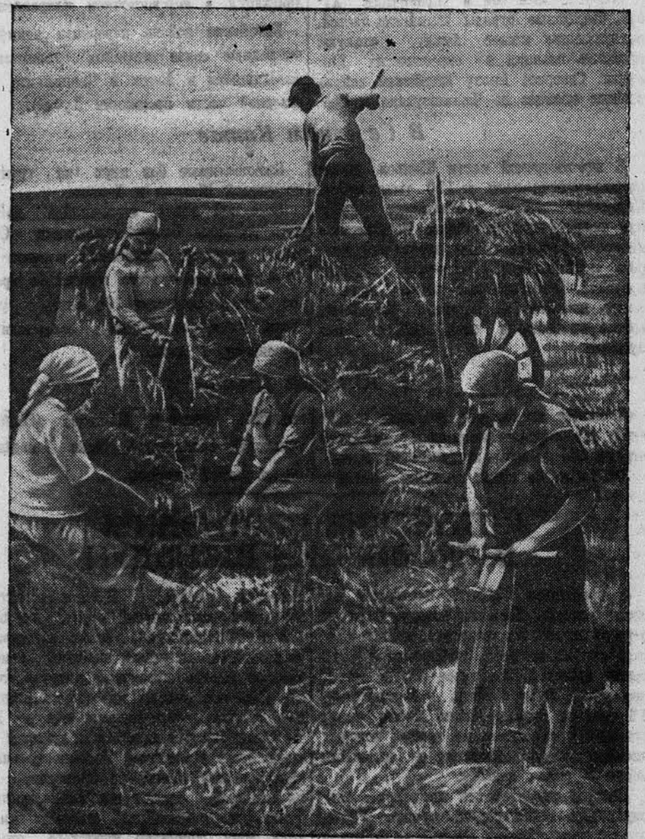
Колхоз „Завет Ильича“ первый в районе выполнил план силосования кормов. НА СНИМКЕ: закладка силоса.