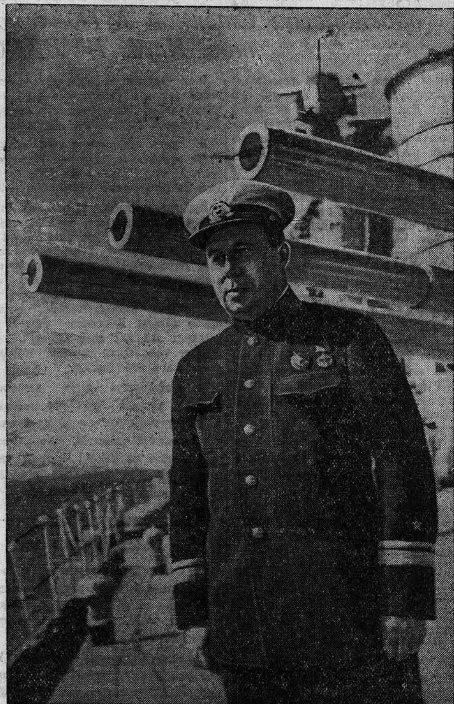
Знатные люди Краснознаменного Балтийского флота. НА СНИМКЕ: флагман 2-го ранга, орденноносен Н. Н. Несн икий.