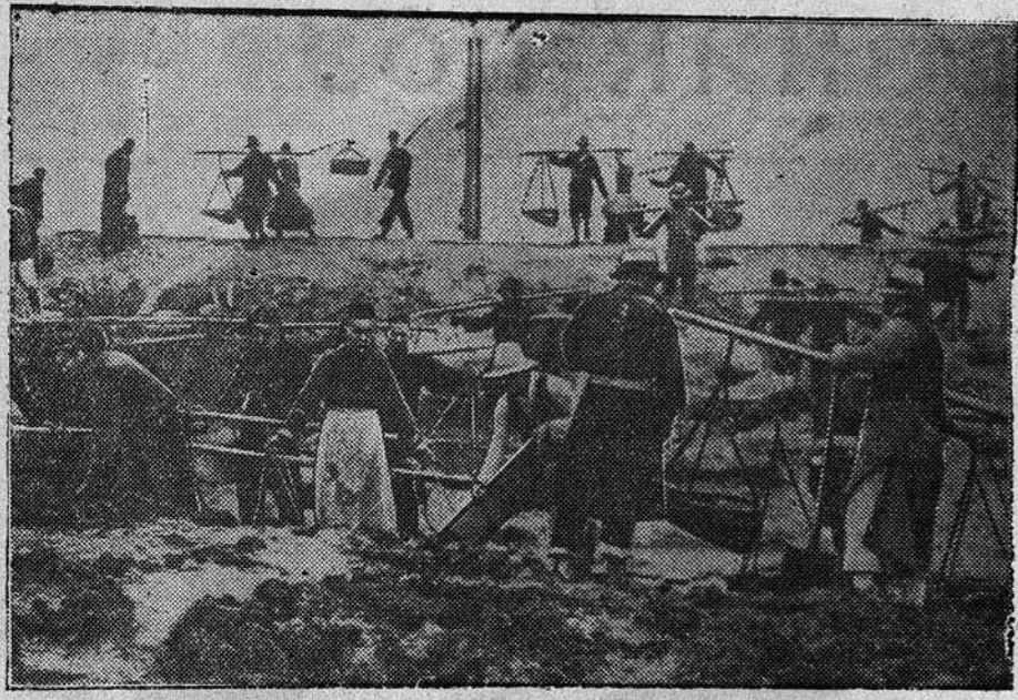
Японские захватчики заставляют население оккупированных ими районов выполнять непосильную работу. НА СНИМКЕ: китайское население на земляных работах в районе Шанхая.