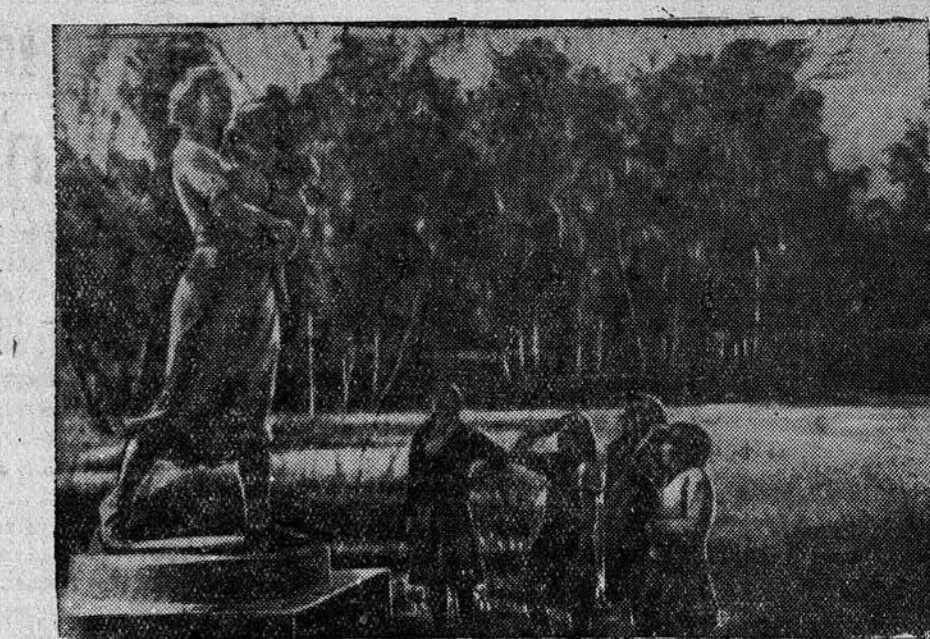
В парке культуры и отдыха мелаженого комбината.