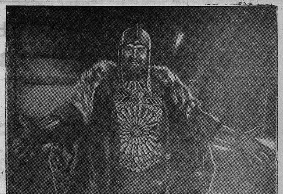
Киностудия «Мосфильм» готовят новый звуковой художественный фильм «Миня и Пожарский». Сценарий орденосца В. Шкловского. Режиссеры — орденосцы В. Пудовкин и М. Доллер. НА СНИМКЕ: Народный артист республики — орденосец Б. Н. Ливанов в роли Пожарского.

Всего озимыми культурами в семенных хозяйствах будет занята площадь в 2.063 гектара, из них 1.271 гектар рожью «Вятка», 178 гектаров рожью «Омск», 139 гектаров пшеницей «Лугосейд 0329», 226 гектаров пшеницей «Эристраперум 0917», 49 гектаров пшеницей «Елочка».