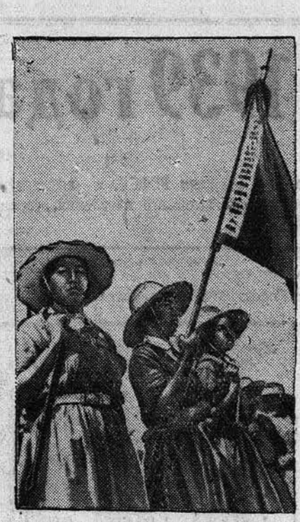
К ВОЕННЫМ ДЕЙСТВИЯМ В КИТАЕ На снимке: китайские женщины — бойцы китайской армии на параде.

ЛОНДОН, 3 июня. (ТАСС). Сегодня английское морское министерство опубликовало заявление, в котором говорится, что в настоящее время нет никакой надежды на спасение лиц, находящихся в затонувшей подводной лодке «Этис». Спасательные работы продолжают.