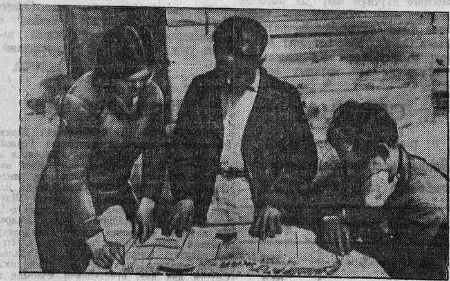
Редколлегия стеничной газеты «За высокий урожай» за просмотром вышедшего номера (колхоз им. Фридриха Энгельса, Шипуновского района).