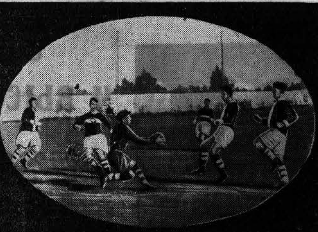
24 мая на стадионе «Локомотив Востока» состоялись футбольные матчи из разряда игр на первенство города между командами обществ «Спартак» и «Локомотив Востока». Во всех трех матчах победили локомотивовцы.