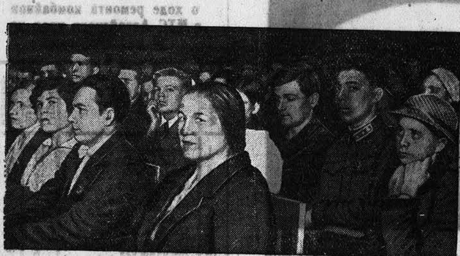
25 мая в Крайдрамтеатре состоялось собрание актива Осоавиахима, посвященное итогам XVIII Съезда ВКП(б) и задачам оборонной работы. НА СНИМКЕ: в зале заседания.