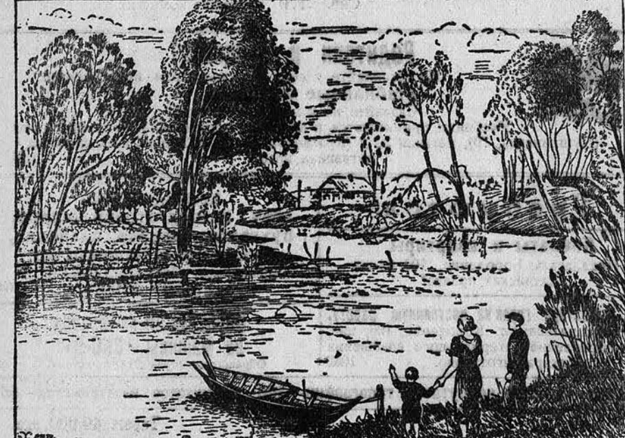
Озеро села Луговое вблизи реки Чумыша, Талды-Мектинского района. Рис. Н. ХАРНА.