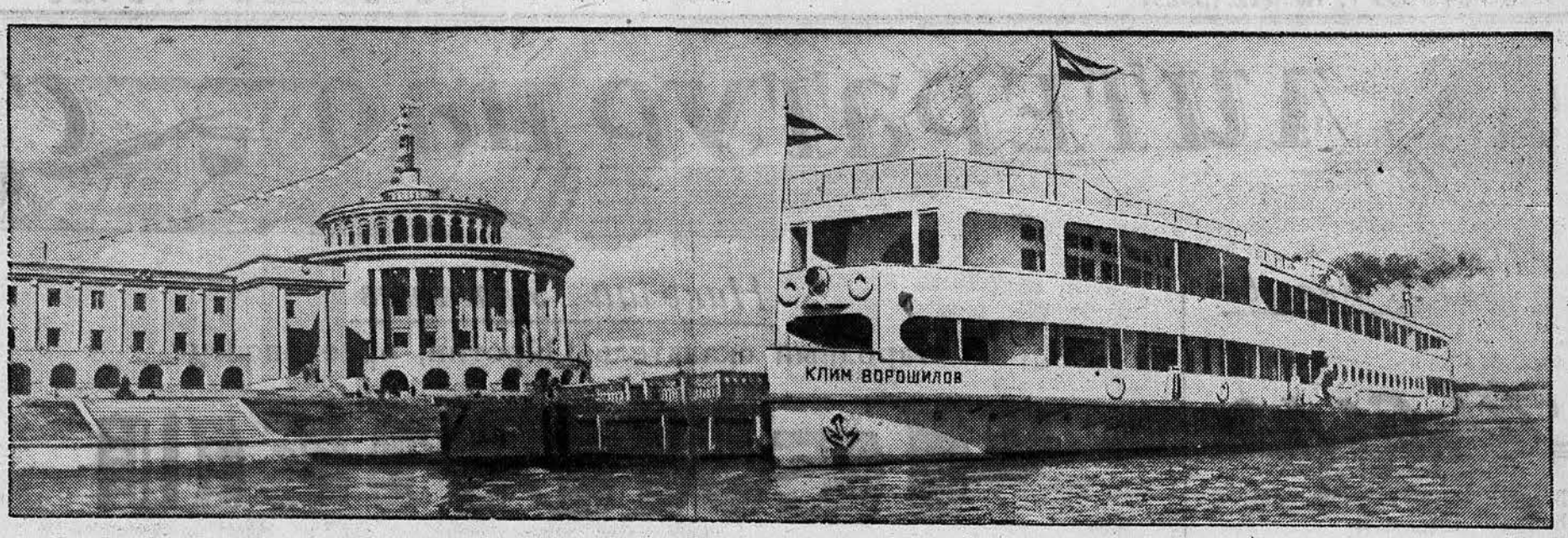
Открытие навигации на канале Москва — Волга. На снимке: теплоход «Клим Ворошилов» у пристани Калининского речного вокзала.