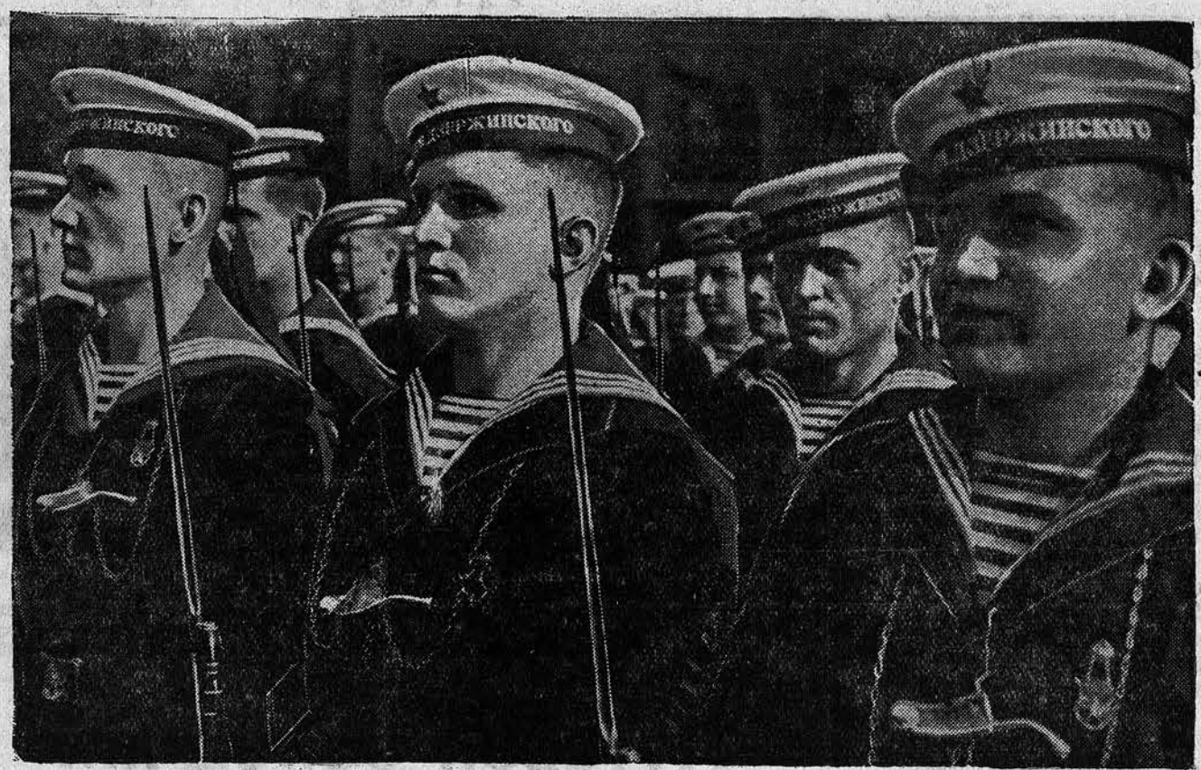
1 Мая 1939 года в Москве на Красной площади состоялся парад частей Рабоче-Крестьянской Красной Армии и Военно-Морского Флота. На СНИМКЕ: курсанты Военно-Морского училища имени Дзержинского на параде.

счет противника. В течение года он захватил у японцев 3000 винтовок, много пулеметов и боеприпасов. «Плохо приходится изменникам-чиновникам созданным японцами марионеточных властей», — пишет газета, — когда они попадают в руки отрядов четвертой армии. Над изменниками устраивается народный суд, который беспощадно приговаривает их к смертной казни. Беспощадные к врагу во время боевых действий, бойцы четвертой армии обращаются чрезвычайно мягко с пленными японскими солдатами. Раненые пленные японцы лежат в лазаретах бок о бок с ранеными бойцами четвертой армии. Последние учат японцев китайскому языку и разъясняют им сущность национально-освободительной войны». 4 мая.