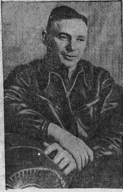
НА СНИМКЕ: Герой Советского Союза тов. В. К. Коккинаки.