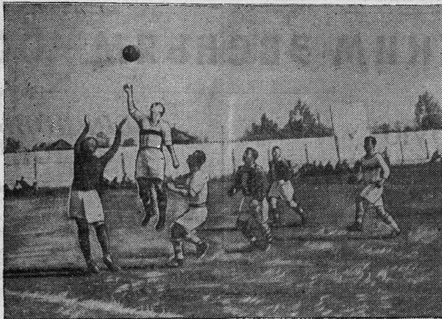
Дружеская встреча между командами «Динамо» и «Локомотив Востока». Момент игры у ворот «Локомотив Востока».