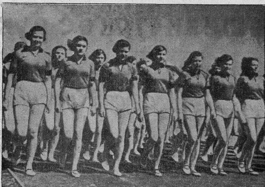
Члены спортивного общества «Учитель» 2-го мая на физкультурном параде на стадионе «Локомотив».

ПРАГА, 30 апреля. (ТАСС). Фашистскими властями в Праге запрещено празднование Первого Мая.