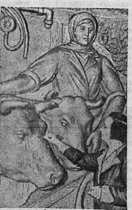
Коллектив работников завода № 2 треста скульптур и облицовки готовит оформление для Всесоюзной сельскохозяйственной выставки.

Начало демонстрации в 11 часов утра. Демонстрация открывает сводная колонна физкультурников, которая движется по Социалистическому проспекту на площадь Свободы.