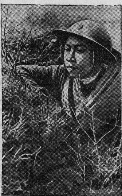
Китайские женщины принимают активное участие в борьбе своего народа против японских захватчиков.

Японцы решили организовать в Амое элитарную власть из предателей-эмигрантов. Однако никто из китайцев не соглашался идти на эти позорные должности.