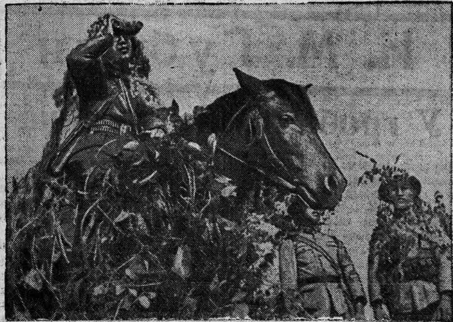
К военным действиям в Китае. НА СНИМКЕ: Командир полка китайской армии наблюдает за воздушным боем.