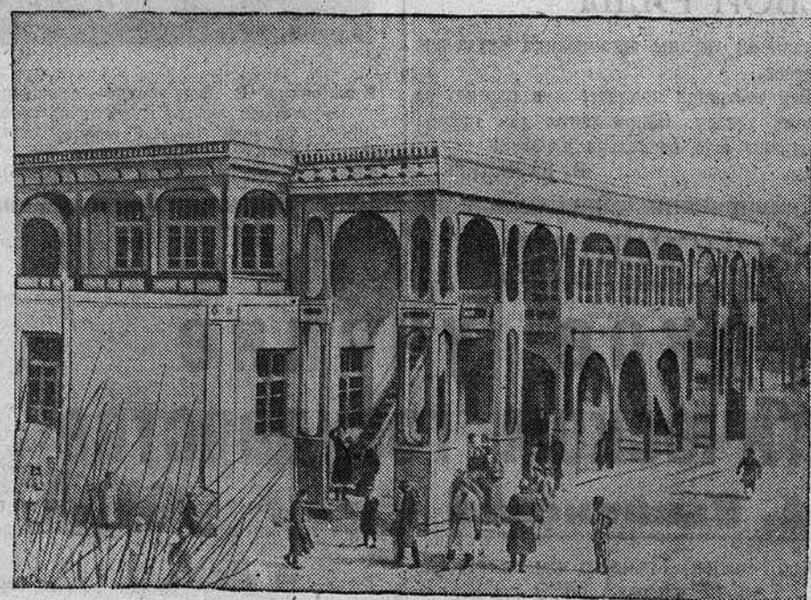
НА СНИМКЕ: новая чайхана в колхозе «Путь Сталина». (Ленинградский район, Талджинская ССР).

— Клянусь высоко держать звание красного воина. В случае новых нападений на нашу родину я этим оружием буду громить любого врага.