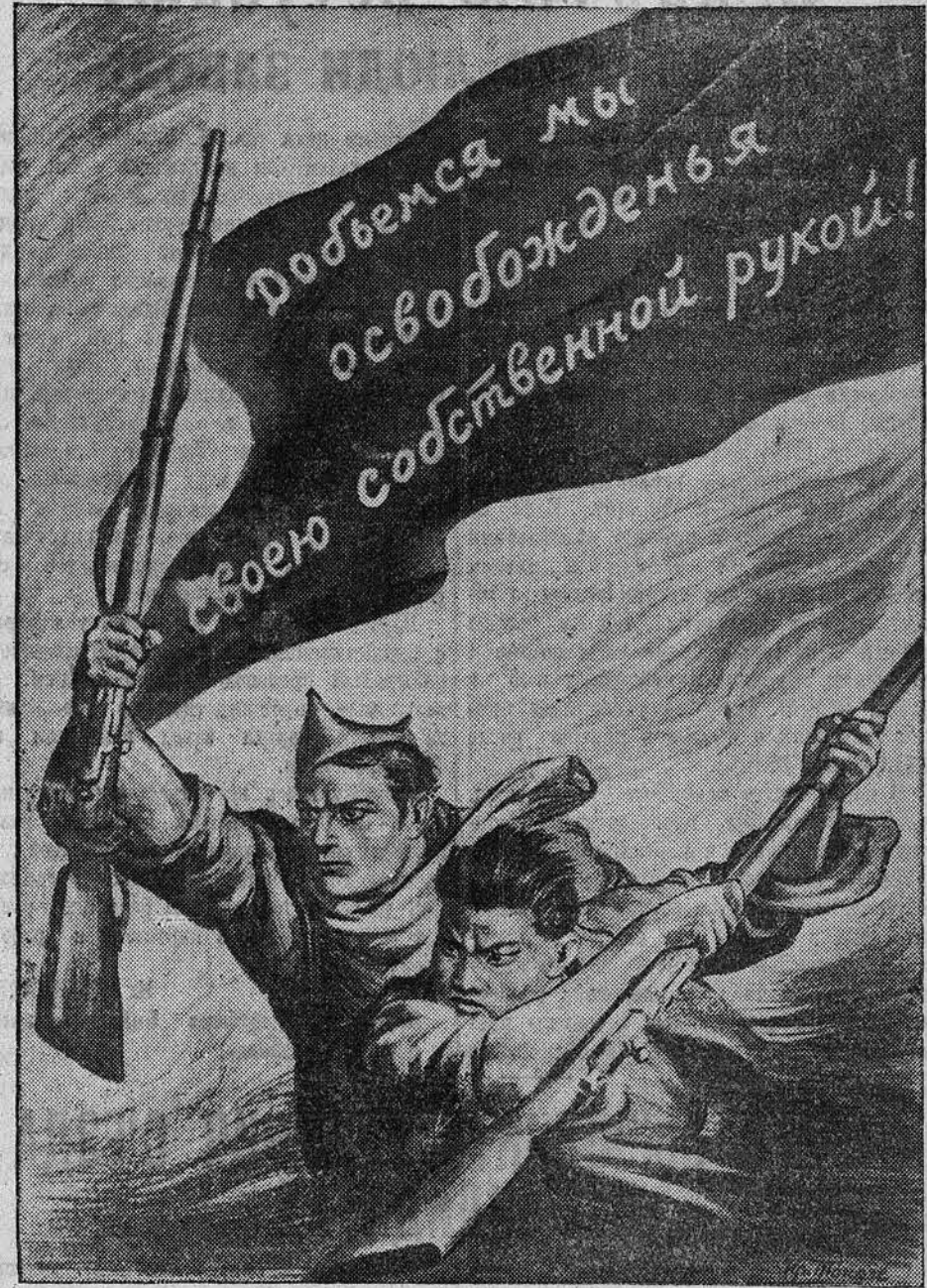
НА СНИМКЕ: плакат художника И. Тондзе, выпущенный к 1 Мая издательством «Искусство».

находит самый горячий отклик в сердцах народов Советского Социалистического Союза, искренне заинтересованных в сохранении всеобщего мира. КАЛИНИН. 16 апреля 1939 года.