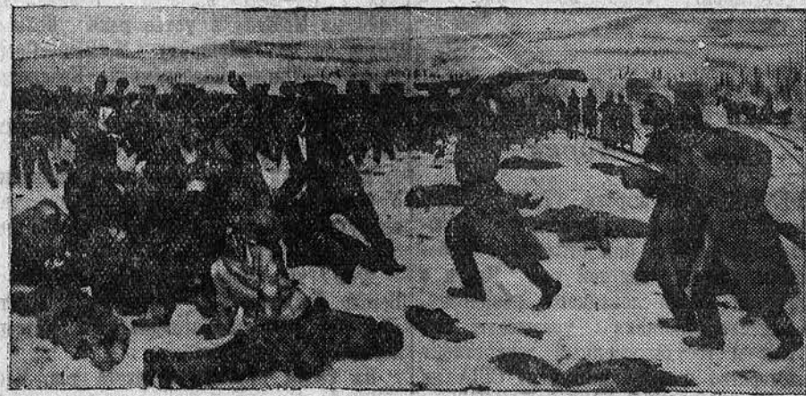
НА СНИМКЕ: картина заслуженного деятеля искусств К. Ф. Юона «На Лене после расстрела».

членные, из которых создавались рабочие стачечные комитеты, они руководили стачкой и собирали денежные средства на нужды забастовки.