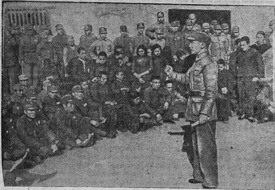
К военным действиям в Китае. НА СНИМКЕ: начальник политотдела одной из дивизий китайской армии проводит беседу среди населения и бойцов в прифронтовом деревне.