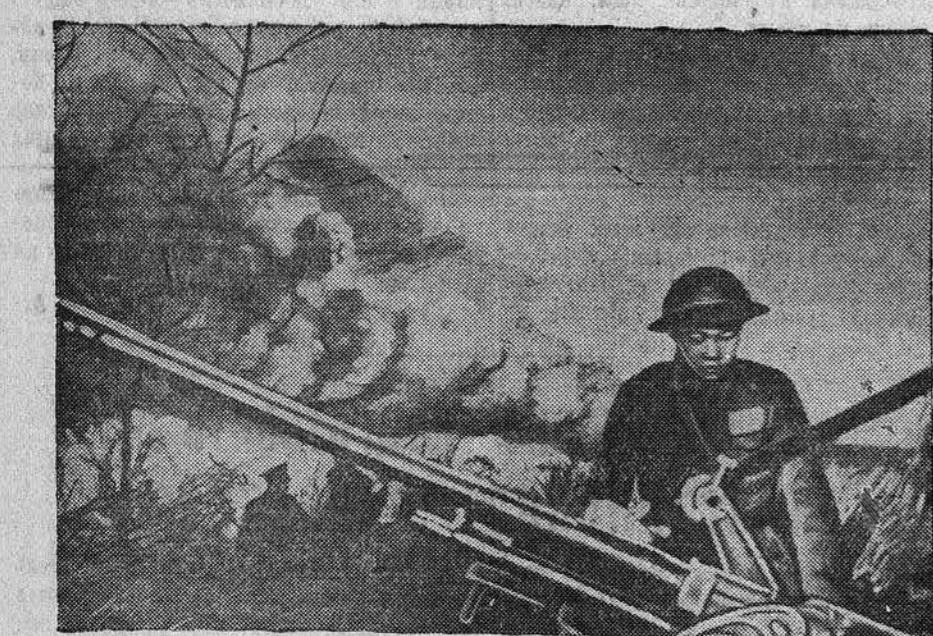
К военным действиям в Китае. НА СНИМКЕ: боец китайской армии у противотанкового орудия.

По данным американской рабочей печати, в США занято на различных работах по найму около 3 миллионов негритянских женщин.