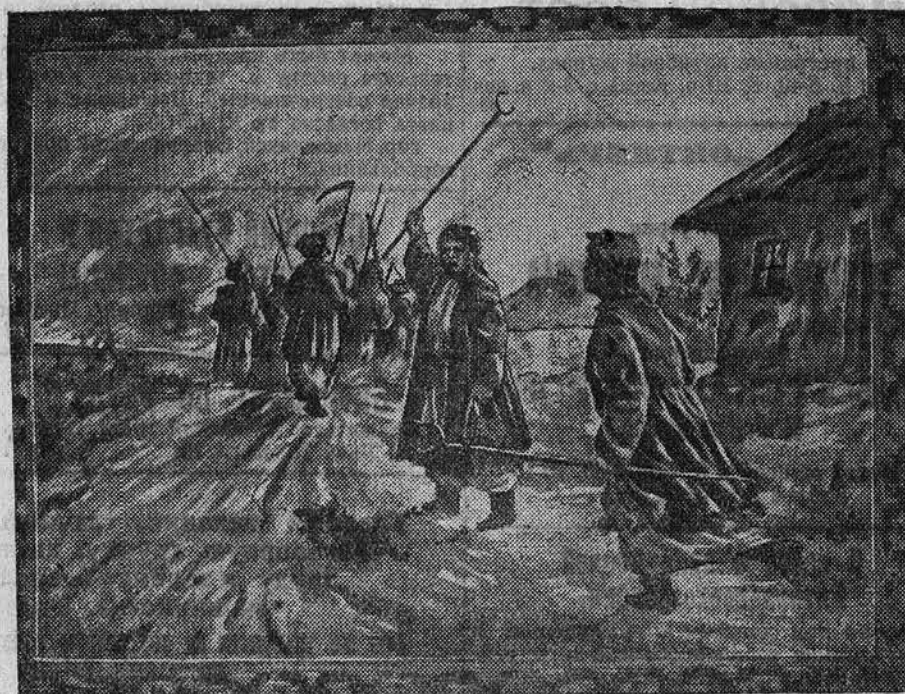
НА СНИМКЕ: эскиз декоративного ковра на тему произведения Шевченко «Гайдамаки», выполненный М. Дьяченко — студентом Кролевского техникума художественного текстиля (Сумская область).