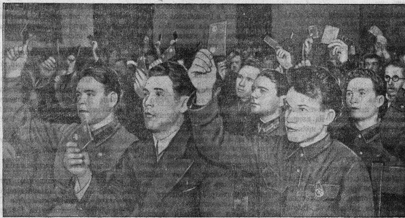
Партийная конференция Центрального района г. Барнаула. НА СНИМКЕ: момент голосования за принятие резолюции по тезисам доклада товарища Жданова на XVIII Съезде ВКП(б).