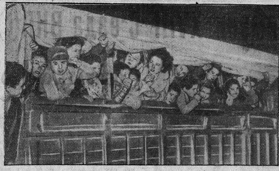
На французской границе скопилось большое количество беженцев из Каталонии. Дети беженцев лишены самого примитивного ухода; больные и раненые не получают никакой медицинской помощи. НА СНИМКЕ: дети беженцев, прибывшие в пограничный пункт Пертос.