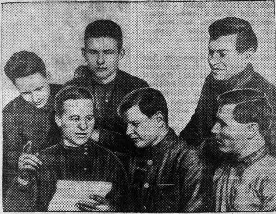
Комсомольская стахановская бригада машинного отделения паркохода «Камь», Боровского судоремонтного завода. По плану бригада должна отремонтировать машину к 10 апреля, она дала обязательство закончить ремонт к 20 февраля в честь XVIII Съезда партии.

В Мамонтовском районе заочников-редакторов стеногазет — 80 человек; Залесовском — 44, Краснозерском — 40.