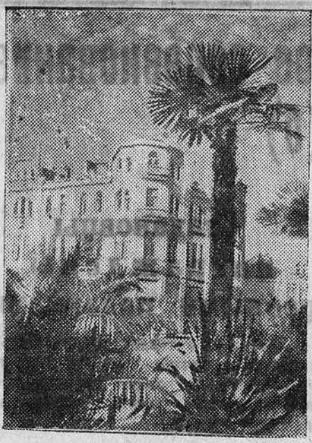
По городам Советского Союза, НА СНИМКЕ: здание городского совета в Сухуми.

В ночь на 3 февраля интервенты бомбардировали Фигерас шесть раз с получасовыми перерывами. Убито 150 человек, около 200 человек ранено. Одна из бомб попала на здание французского консульства, где помещается сейчас посольство Франции. Город Херона также подвергся неоднократным бомбардировкам.