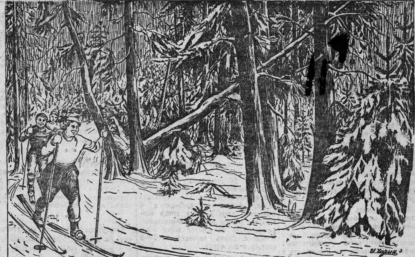
На лыжной прогулке в Барнаульском бору.

На остальных фронтах положение без перемен.