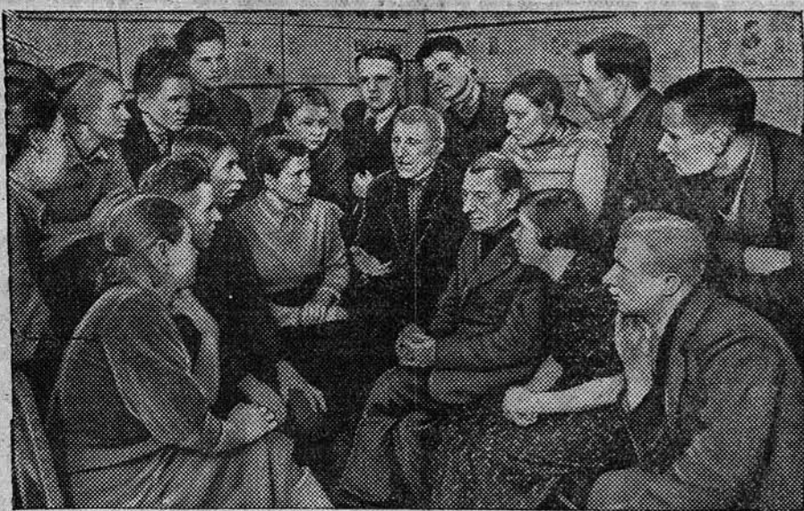
К 15-летию со дня смерти В. И. Ленина. На заводе имени Владимира Ильича (Москва) много кадровых рабочих, лично встречавшихся с В. И. Лениным...