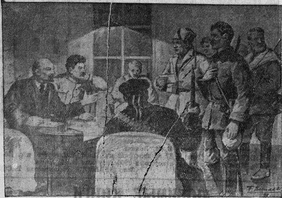
НА СНИМКЕ: В. И. Ленин и И. В. Сталин беседуют с красногвардейцами в Смольном, 1917 г. (Художник П. Васильев. Акварель).