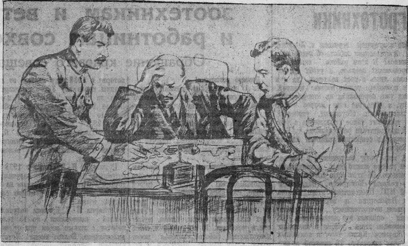
НА СНИМКЕ: В. И. Ленин, И. В. Сталин, К. Е. Ворошилов за картой. С рисунка художника П. Васильева.

На выставке будут широко представлены портреты, гравюры и рисунки русских и иностранных художников.