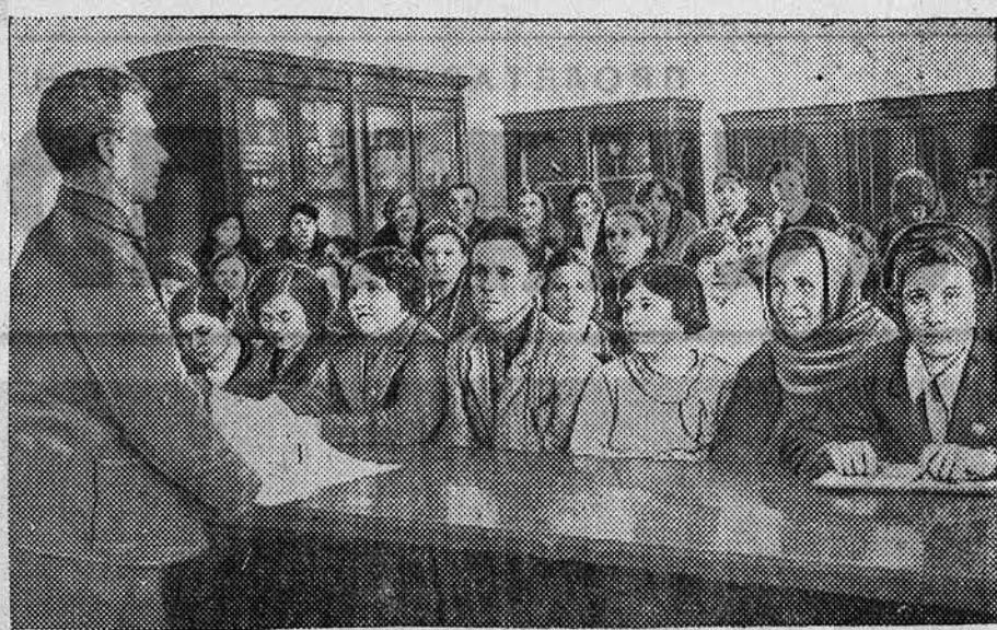
16 января в 5 переписном отделе Центрального района г. Барнаула состоялось совещание счетчиков и инструкторов-контролеров с вопросом о готовности к Всесоюзной переписи населения.