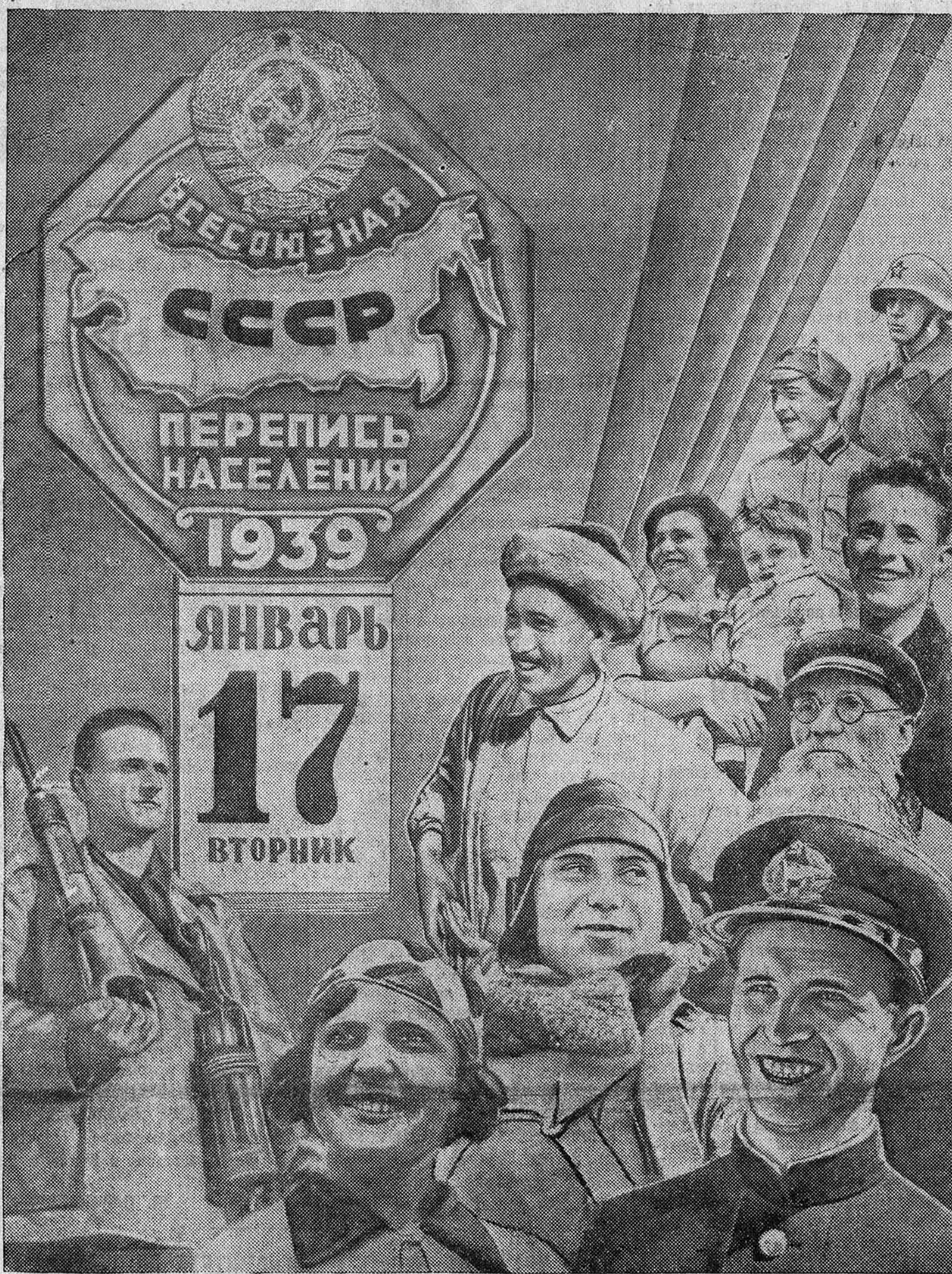
Фотомонтаж худ. И. ЧИСПИЯКОВА.