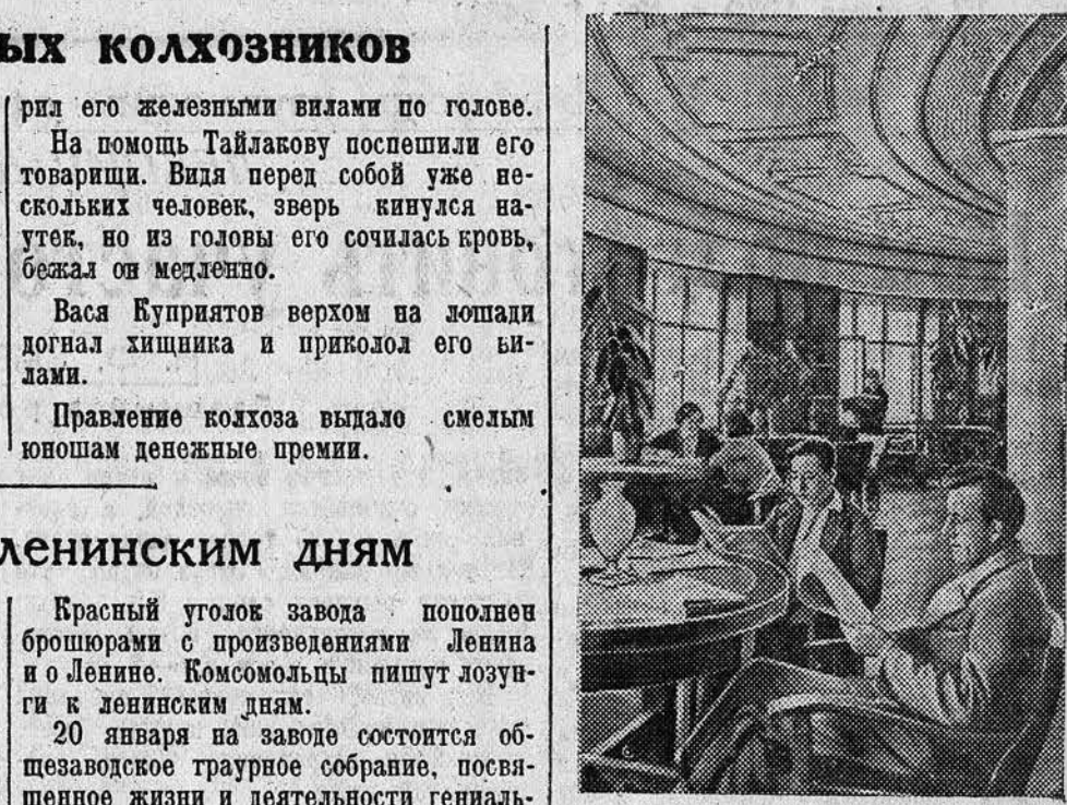
НА СНИМКЕ: в читальном зале библиотеки Дворца металлургов — г. Сталинка (Новосибирская область).