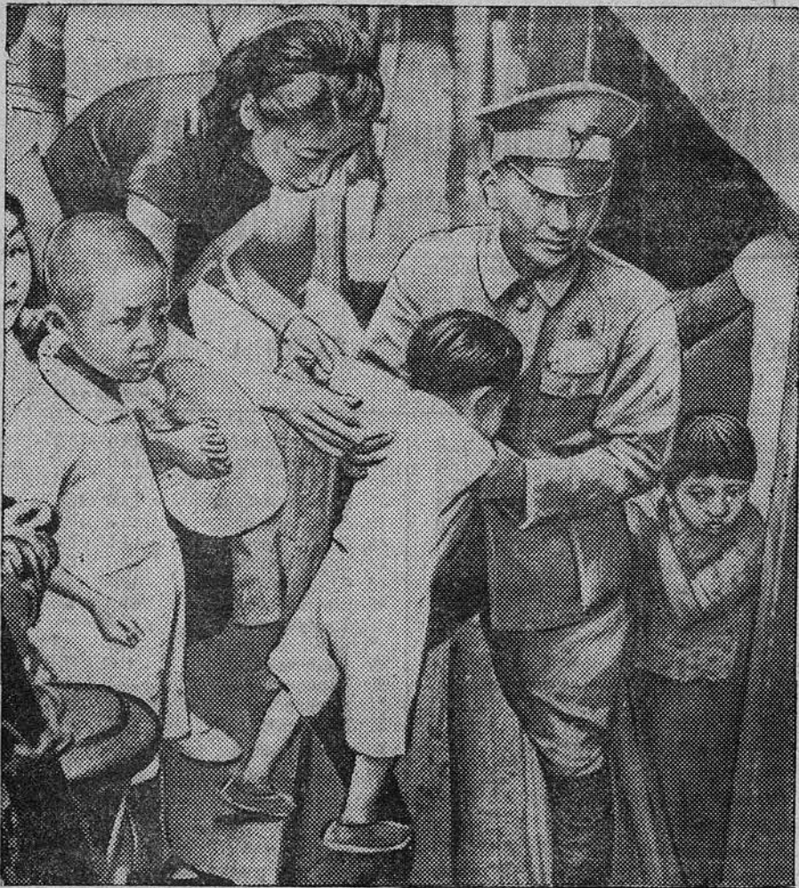
Японские самураи при захвате городов зверски расправляются с мирным населением. При приближении японцев китайское население покидает насиженные места, спасаясь бегством. Китайская общественность организует широкую помощь беженцам. НА СНИМКЕ: члены комитета помощи беженцам эвакуируют детей из населенного пункта, находящегося под угрозой вторжения японцев.