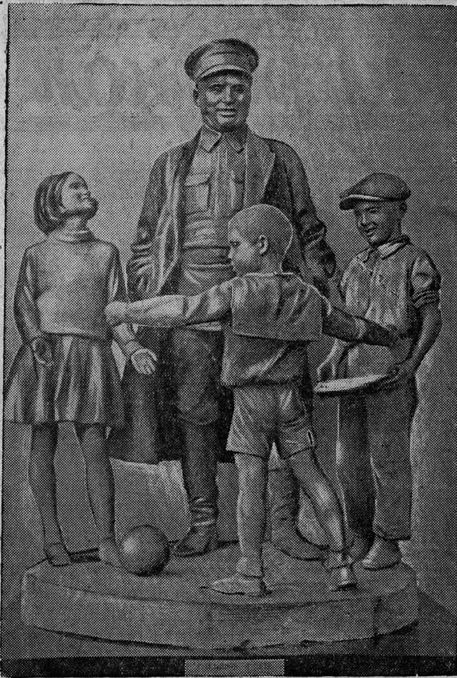
По решению ЦК ВКП(б) в Ленинграде создан музей С. М. Кирова. Музей помещается в историческом здании (бывший особняк Кшесинской), где в 1917 году находился штаб нашей славной большевистской партии.

ТЕЛЕФОНЫ РЕДАКЦИИ: кабинет отв. редактора—6, отдел сельского хозяйства и пром. отдел—471, дежурный телефон (круглые сутки)—346, директор типографии—7 через коммутатор, типографии—306, коммутатор издательства—504