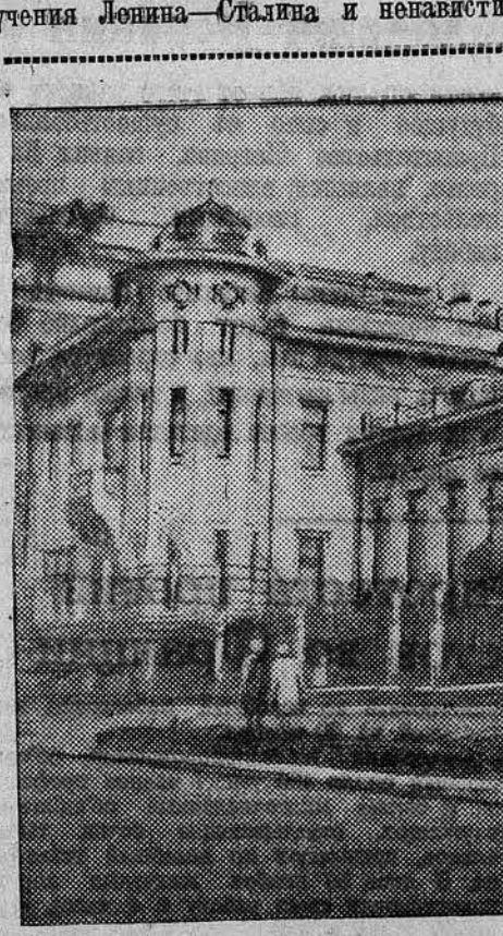
Здание музея С. М. Кирова в Ленинграде.

Вот плац Ленинграда. На нем отмечены предприятия, где выступал Сергей Миронович: 16 ретей из фабрика и заводов в течение одного месяца, 149 больших выступлений за два года! Полный глубочайшей веры в правоту учения Ленина—Сталина и ненависти