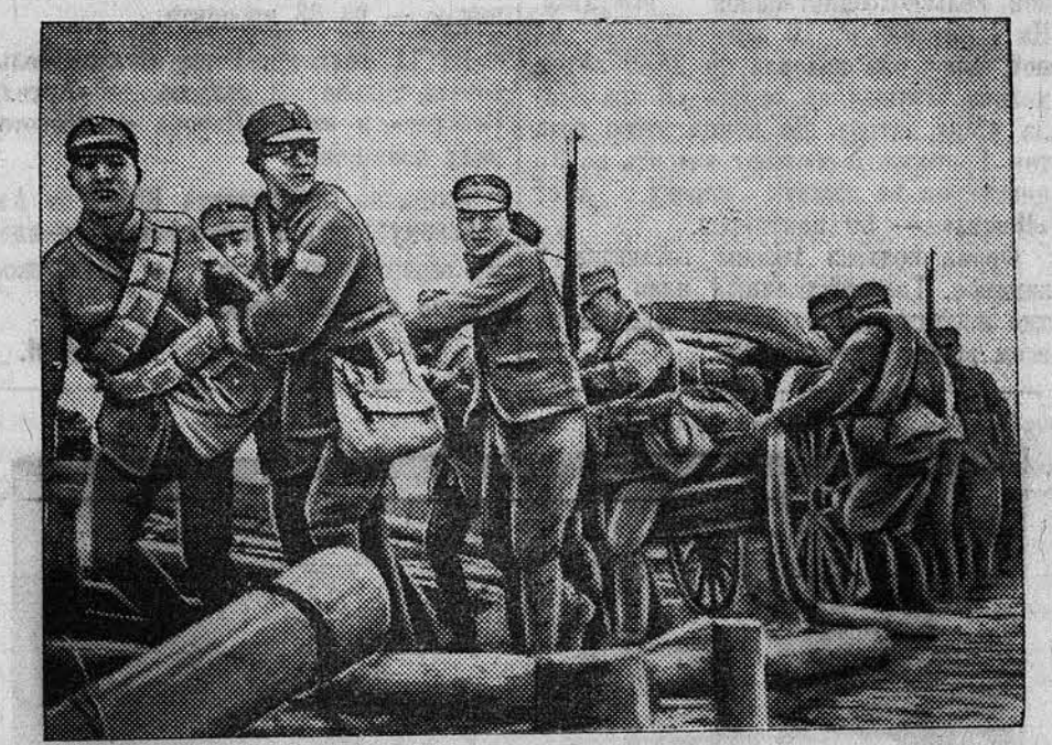
Героическая армия китайского народа одерживает крупные победы в боях против японских самураев. НА СНИМКЕ: бойцы китайской армии доставляют продукты питания на линию фронта.

Сейчас, применяя свой изобретенный маневр, японские командования пытаются охватить китайские войска, заступающие подступы к Ханькоу.