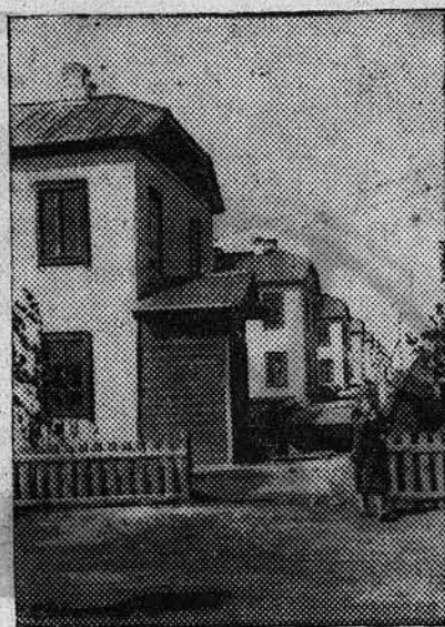
Рабочий поселок из стандартных домов Барнаульского меланжевого комбината.

На 5 октября план уборки свеклы по сырьевой базе Алтайского сахарного завода выполнен только на 43 процента.