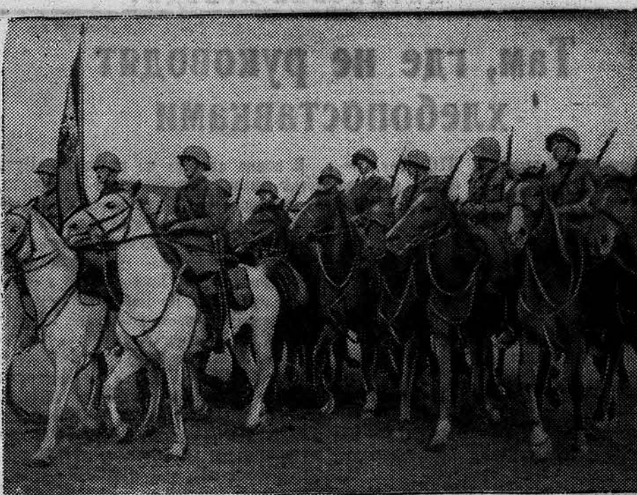
Парад войск Московского военного округа. 8 сентября в районе учений состоялся парад войск Московского военного округа, посвященный окончанию осенних учений. НА СНИМКЕ: артиллерийская часть на параде.

Справедливый приговор пролетарского суда над контрреволюционной кулацкой бандой встретил всеобщее одобрение слушателей процесса. Свыше тысячи трудящихся Ребрихского района, присутствующих на процессе, отвечая на приговор аплодисментами, выразили свою готовность бороться со всеми и всякими врагами народа, за колхозный строй, за выполнение великих задач, которые поставлены перед колхозниками партией, советским правительством и лично товарищем Сталиным.