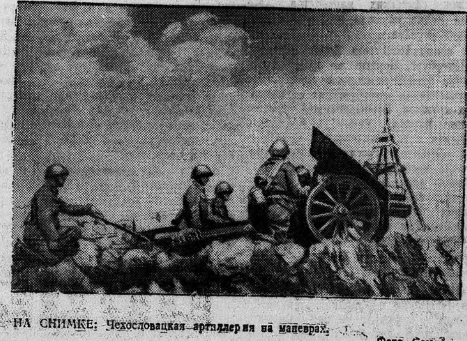
НА СНИМКЕ: Чехословацкая артиллерия на маневрах.

тельством. Агентство указывает: топ германской печати и продолжение германской мобилизации, повидному, имеют целью не допустить того, чтобы генлейновцы и чехословацкое правительство спокойно вели переговоры. Нельзя упускать из виду и того обстоятельства, — пишет в заключение агентство, — что в то время как Гитлер настаивает на Чехословакию за ее ссылки на германскую мобилизацию в мае этого года, он почти не касается происходивших сейчас в Германии военных маневров, в которых участвует полтора миллиона человек. Пока эти маневры не закончатся и пока настроены в Германии остаются таким, как оно есть в настоящее время, нельзя считать, что опасность войны миновала и угроза миру в Европе устранена».