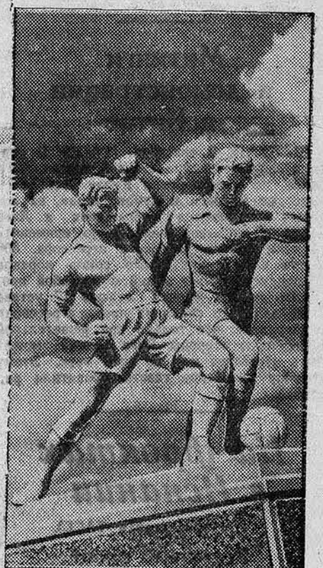
НА СНИМКЕ: скульптурная группа «Футболисты», установленная на стадионе «Динамо» в Одессе.

— Тот день счастливый недалек, Богда, кровава след, Враг вынет силы наутек, И вспыхнет голубой восток Зарей твоих побед.