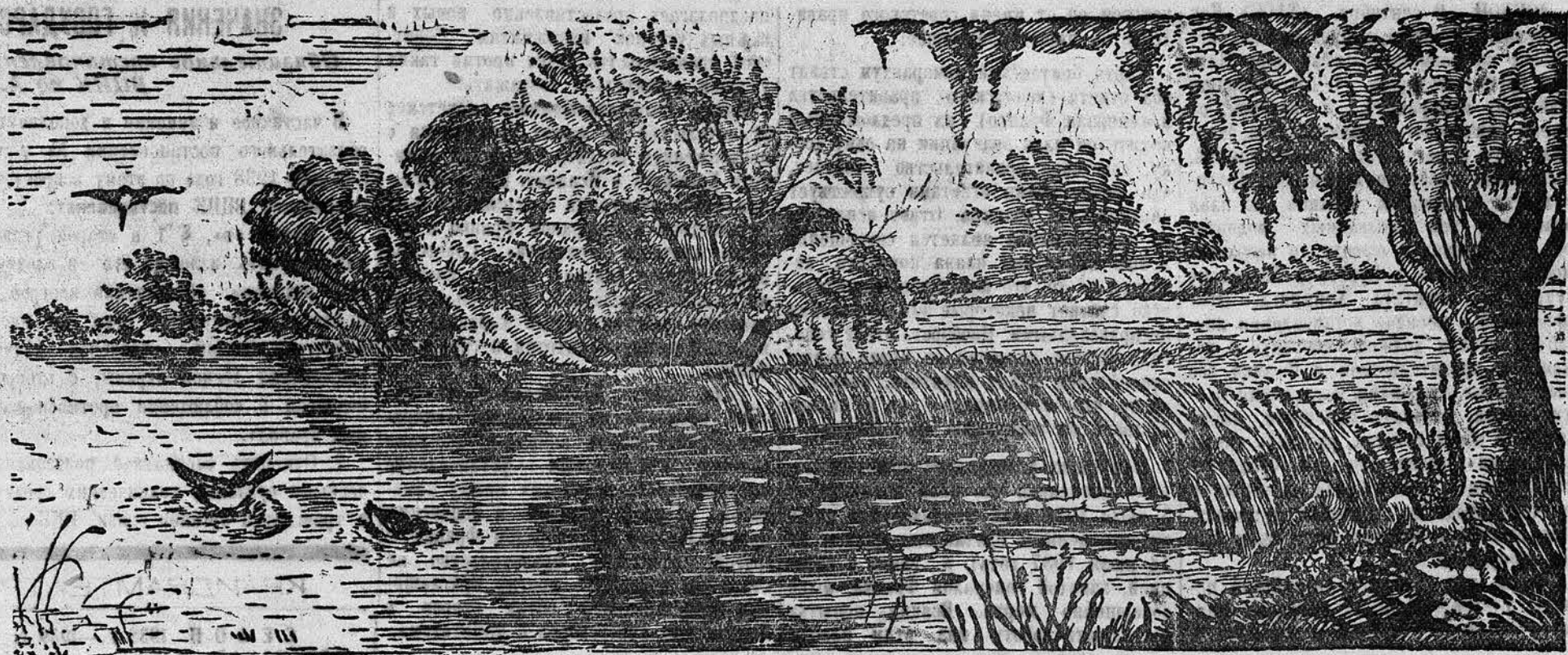
Озеро Копыловское, близ села Гоньба, Барнаульского сельского района.

Расцветай же, прекрасная жизнь, Ширь радость, не зная границы. Торжествуй, неба синего высь, Улыбайся, простор солнцеликий!